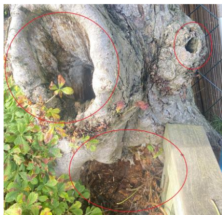
Afbeelding 3: foto van diverse holtes / rottingen