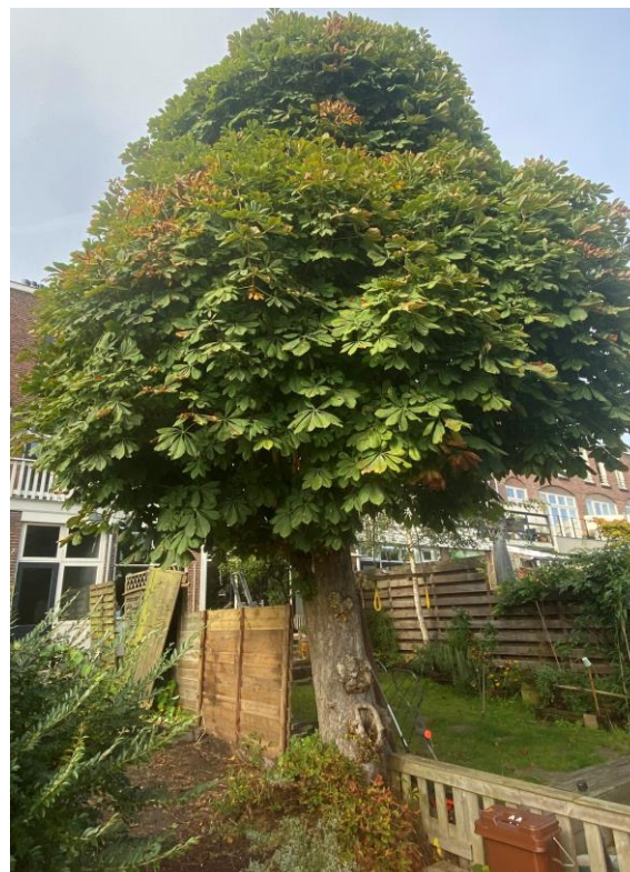
Afbeelding 2: foto van de boom