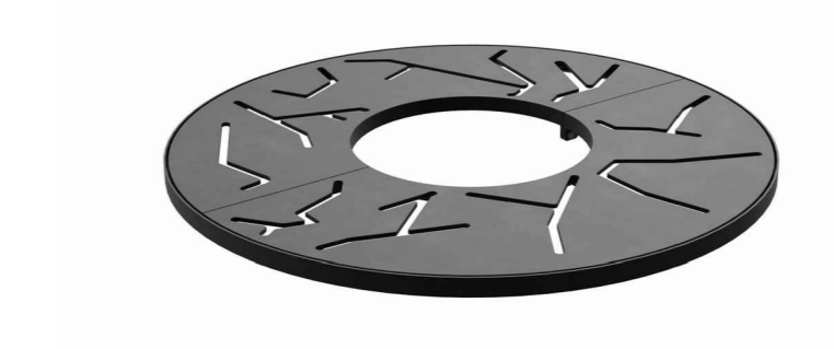
BOOMROOSTER - SOLITAIRE BOOM