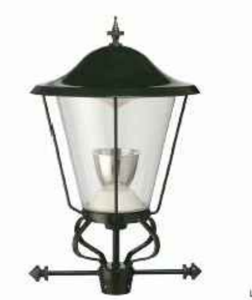
LICHTTOP - OGR