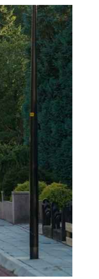
LICHTMAST - GLAD ALUMINIUM