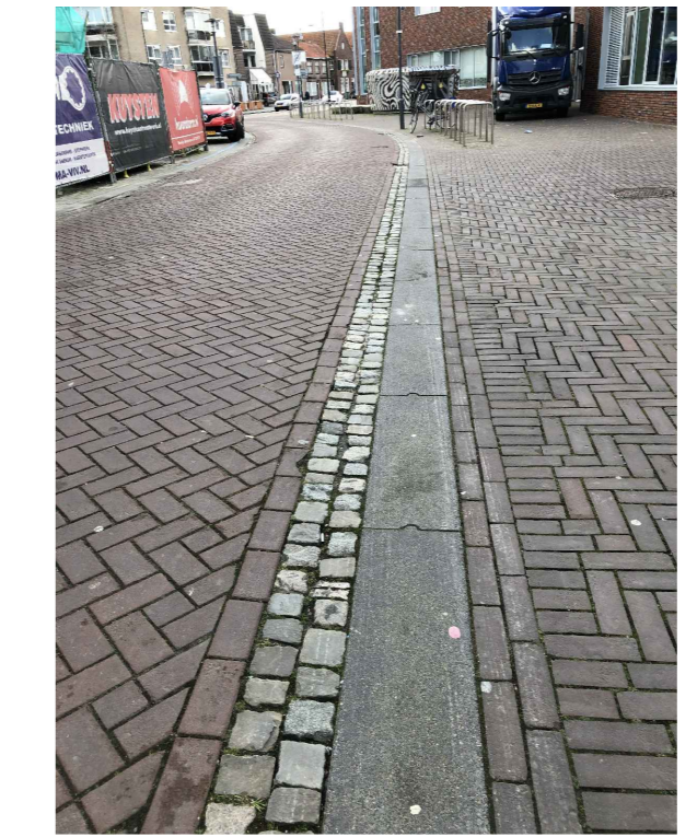
MATERIALISATIE RIJBAAN & TROTTOIR