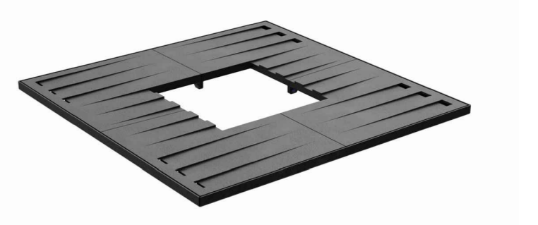
BOOMROOSTER - LEILINDES