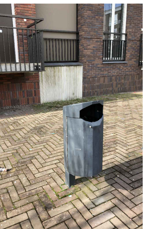
PRULLENBAK - GELIJK AAN ANTONPIECKPLEIN