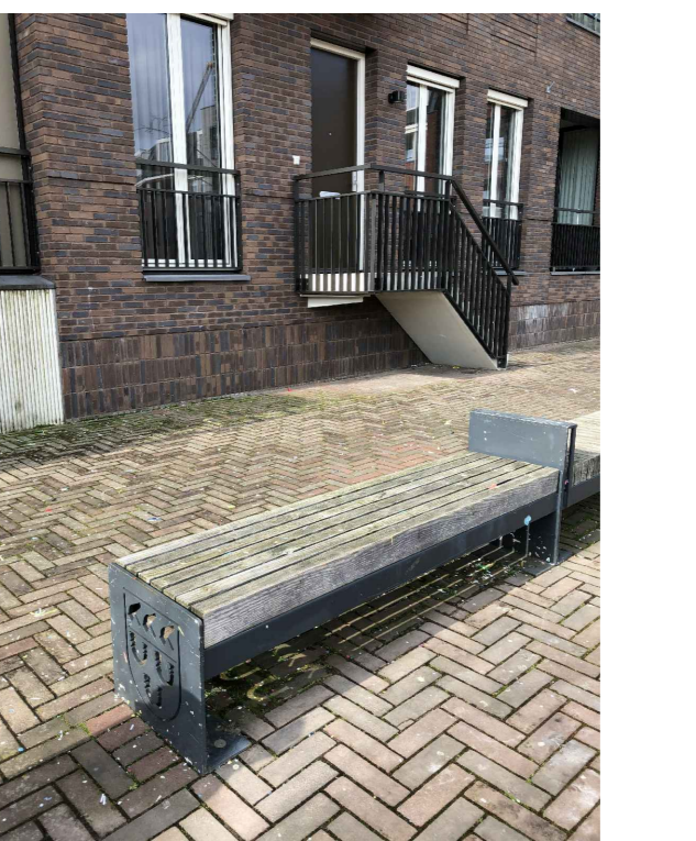
ZITBANK - GELIJK AAN ANTONPIECKPLEIN