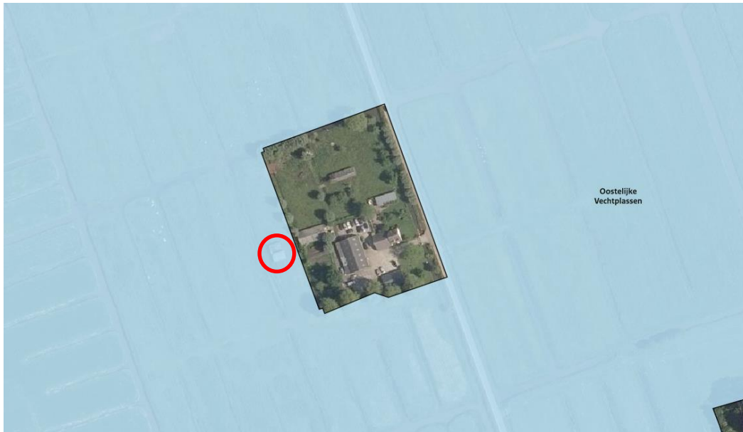
Ligging van Natura 2000-gebied in de omgeving van het plangebied.

Het plangebied ligt grotendeels buiten Natura 2000, alleen de meest westelijke schuur ligt binnen de begrenzing van het Natura 2000-gebied Oostelijke Vechtplassen. Op onderstaande afbeelding wordt de ligging van Natura 2000-gebied in de omgeving van het plangebied weergegeven. Het deel van het plangebied dat tot Natura 2000 behoort, is aangewezen als Vogelrichtlijngebied.