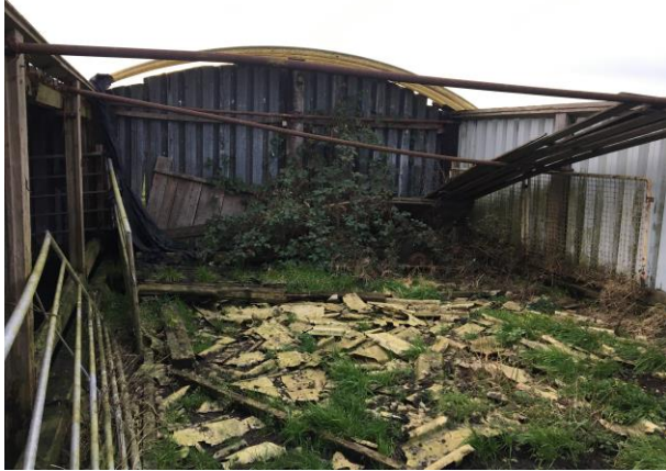
Mogelijk bezetten amfibieën een winterrustplaats onder het afval in de veldschuur.

Door het verwijderen van rommel uit de veldschuur wordt mogelijk een amfibie gedood en wordt mogelijk een vaste (winter)rustplaats beschadigd en/of vernield. Als gevolg van de voorgenomen activiteiten neemt de geschiktheid van het plangebied als foerageergebied voor grondgebonden zoogdieren niet af.