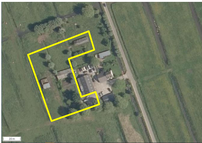
Begrenzing van het onderzoeksgebied. Deze wordt met de gele lijn aangeduid.

Er vinden slechts activiteiten plaats in een deel van het plangebied zodat alleen de te slopen gebouwen en de uitbreidingslocatie in het plangebied zijn onderzocht. Op onderstaande luchtfoto wordt het onderzochte gebied weergegeven (gele lijn). Indien verderop in dit rapport gesproken wordt over plangebied, dan wordt onderstaand gebied bedoeld.