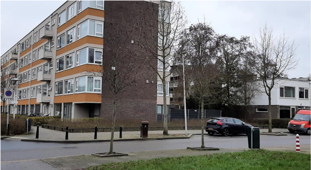
Foto te verplanten boom