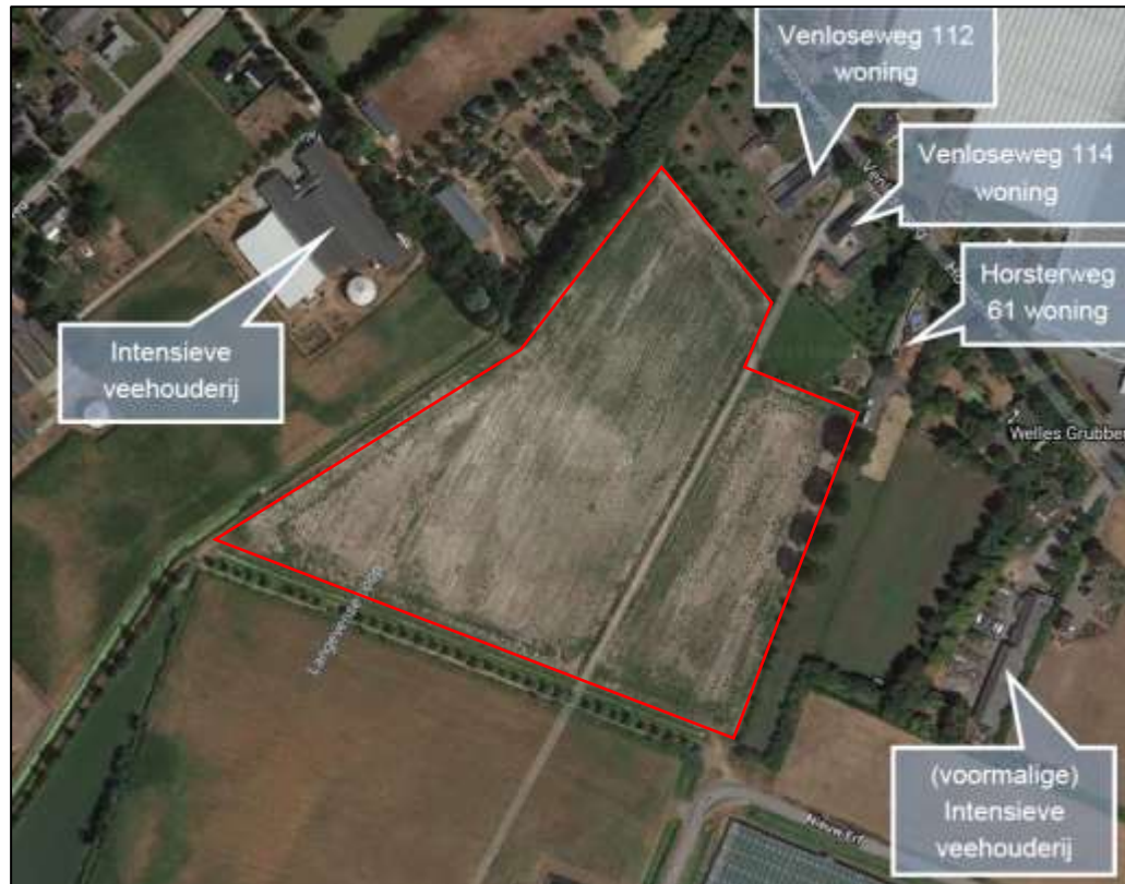
Figuur 2. Globale begrenzing plangebied PV-velden Noord (Google Maps)