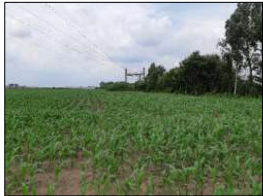
Foto 6. Maïsakker; zuidoosten van plangebied