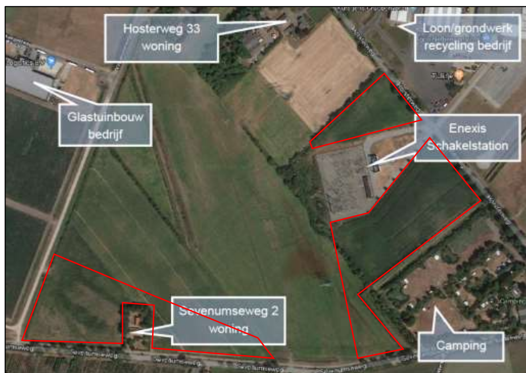
Figuur 3. Globale begrenzing plangebied PV-velden Zuid