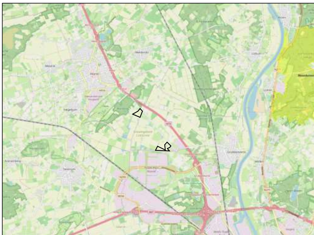
Figuur 4. Ligging plangebieden (zwarte figuren) ten opzichte van het dichtstbijzijnde Natura 2000-gebied (geel)

Uit de kaarten van de gebiedendatabase op de website van het ministerie van Landbouw, Natuur en Voedselkwaliteit (LNV) blijkt dat het dichtstbijzijnde Natura 2000-gebied op circa 4,8 kilometer afstand van het plangebied ligt, zie figuur 4. Dit betreft het Natura 2000-gebied Maasduinen ten noordoosten van het gebied. Ten westen van het plangebied ligt het Natura 2000-gebied Deurnsche Peel & Mariapeel. Dit gebied ligt op circa 10 kilometer afstand van het plangebied.