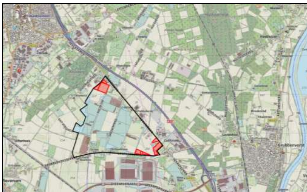
Figuur 1. Ligging plangebieden Nieuw Erf te Horst (PV-velden Noord) en Horsterweg en Sevenumseweg te Grubbenvorst (PV-velden Zuid) (gele lijn) in de bredere omgeving

De ligging van het plangebied in de bredere omgeving is weergegeven in figuur 1. De globale begrenzing van het onderzoeksgebied is weergegeven in figuur 2. Op pagina 7 en 8 is een foto-impressie van het plangebied opgenomen.