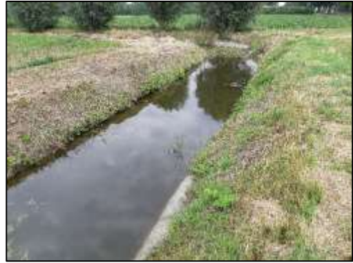
Foto 2. Kanaal in noorden van plangebied