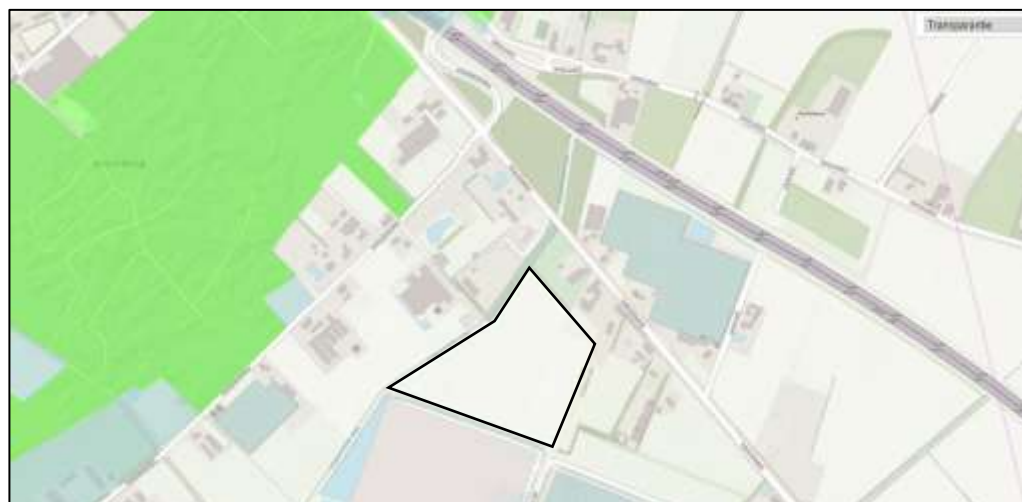
Figuur 6. Ligging plangebied PV-velden Noord (zwarte figuur) ten opzichte van het dichtstbijzijnde gebied dat is aangewezen als beschermd gebied