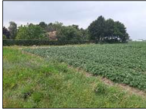
Foto 10. Bietenakker met bloemrijke akkerrand; zuidwesten van plangebied