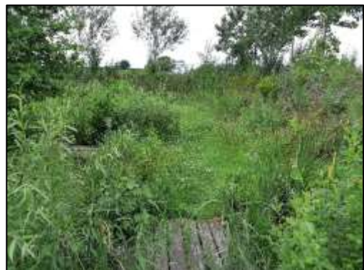
Foto 8. Structuurrijke omgeving van zuidoostelijke akker