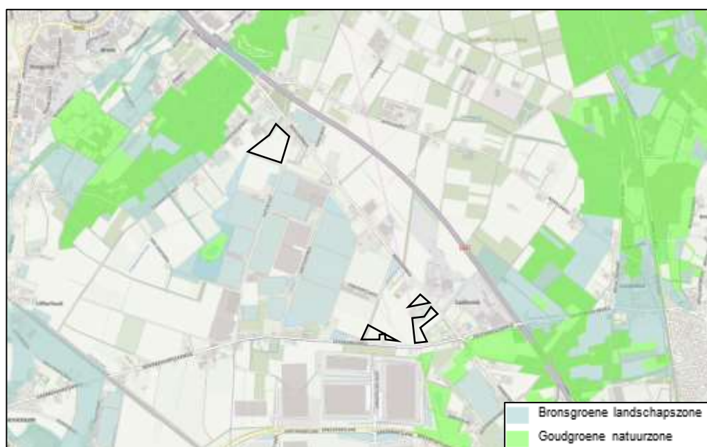
Figuur 5. Ligging plangebieden (zwarte figuren) ten opzichte van het dichtstbijzijnde gebied dat is aangewezen als beschermd gebied (bron: https://www.polviewer.nl/ )

De ligging van het natuurnetwerk in Limburg is opgenomen in het Provinciale Omgevingsplan Limburg 2014 (Geconsolideerde versie Omgevingsverordening Limburg 2014 (GC05) 2018-02-23, geconsolideerd (NL.IMRO.9931.GCVOOmgeving2014-GC05)). Zoals blijkt uit het POL 2014 maakt het plangebied geel deel uit van de goudgroene natuurzone (NNN). De ligging van de goudgroene natuurzone ten opzichte van het totale plangebied is weergegeven in figuur 5. En de ligging van de beoogde PV-velden ten opzichte van het beschermd gebied is weergegeven in figuren 6 en 7 op de volgende pagina