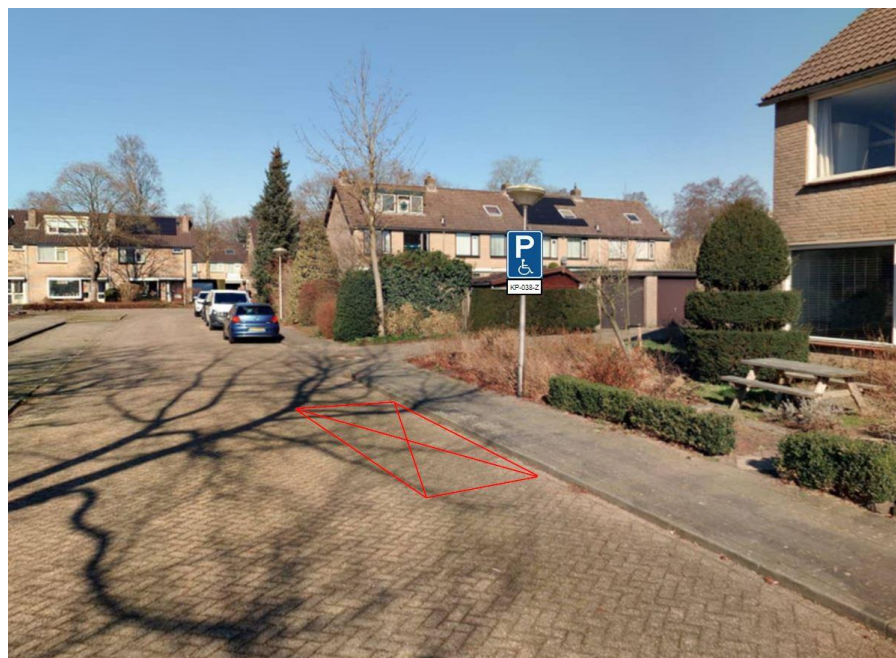
Buntplein 1, Maarn