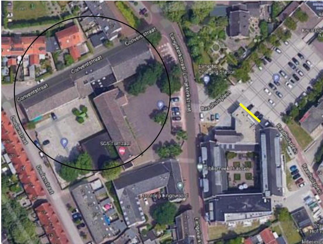
Figuur 5: de gele lijn geeft de locatie weer waar de tijdelijke gierzwaluwkasten uit het plangebied naartoe worden verplaatst. Plangebied aangegeven met zwarte cirkel (Vleut, 2021)