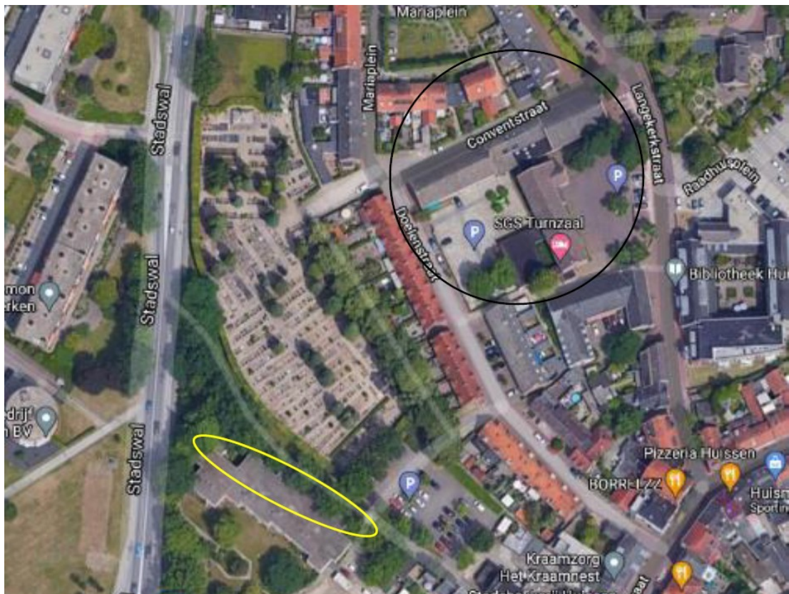
Figuur 3: locatie extra huismuskasten binnen gele cirkel. De zwarte cirkel geeft het plangebied weer (Vleut, 2021)