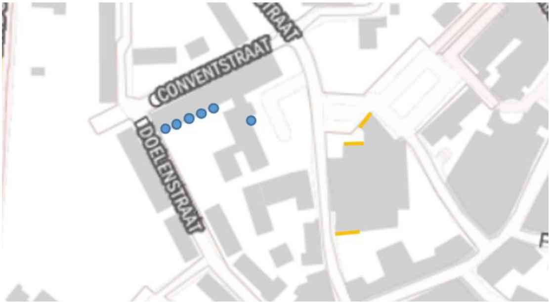
Figuur 2: Locaties tijdelijke huismuskasten aangegeven met gele lijnen. Blauwe stippen geven de huidige nestlocaties van de huismus weer (Den Otter, 2021)