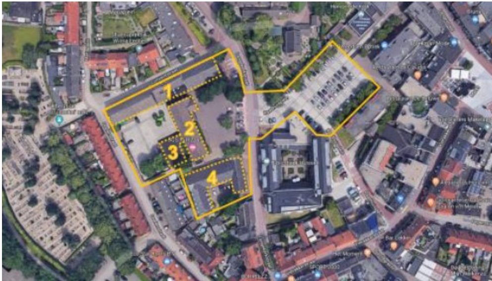
Figuur 1: Plangebied binnen gele kader. Ontheffing ziet op gebouw 1, 2 en 3 (Den Otter, 2021)