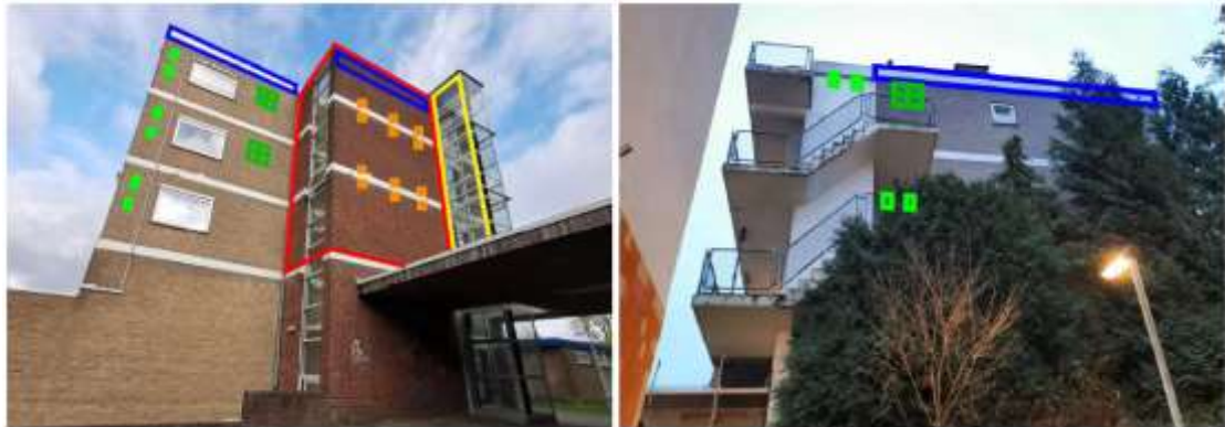
Figuur 2. Mitigerende maatregelen op de kopgevels van flat 2: