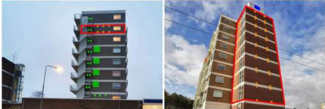
Figuur 6. Mitigerende maatregelen op de kopgevels van flat 1: