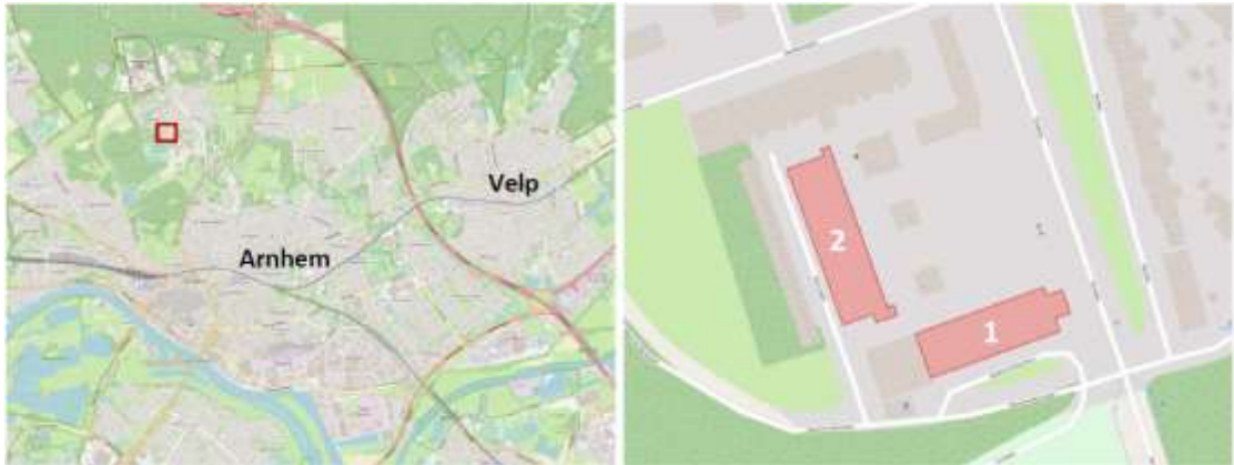
Figuur 1. Globale ligging plangebied (links) en de te renoveren flats (recht) aan het Omerusplein 1 t/m 55 (flat 1) en Omerusplein 56 t/m 83 (flat 2).