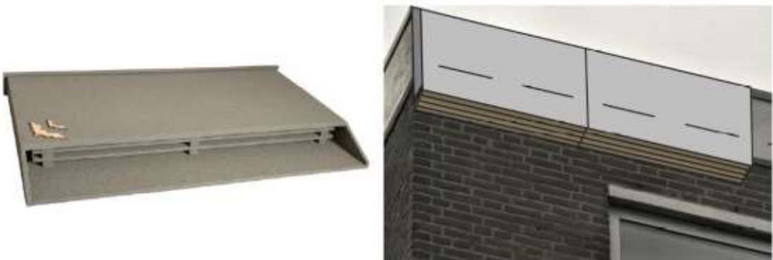
Figuur 5. Grote externe kast (3 stuks) aan de voor vlemuizen ongeschikte dakrand. Merk Vivara, type 'VK SK 03' of vergelijkbaar.