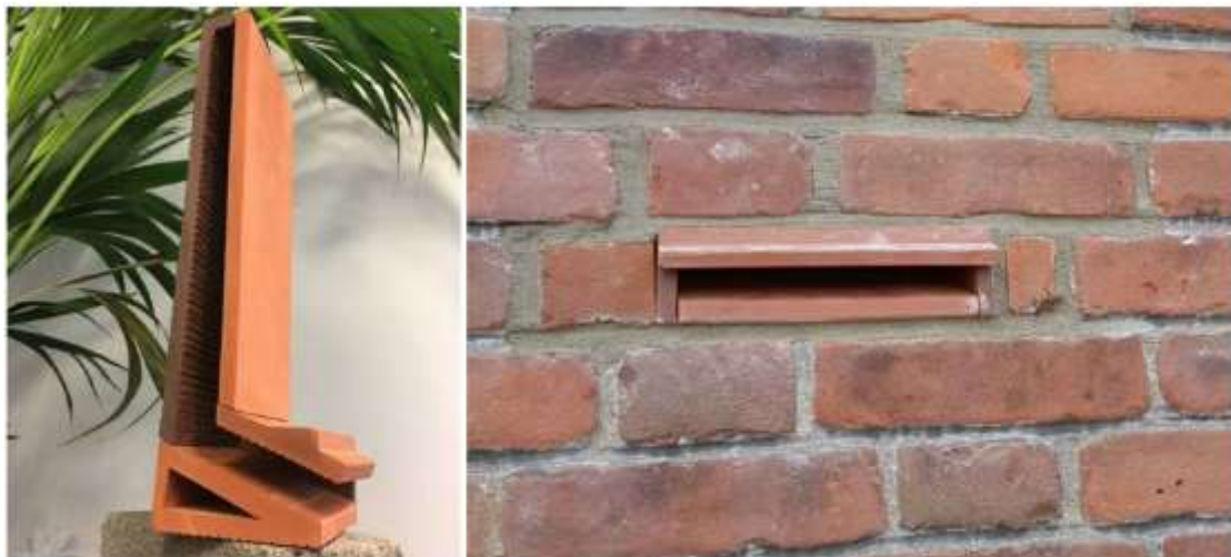
Figuur 3. Permanente vleermuiskasten (10 stuks) als zomer- en paarverblijfplaats. Merk Tichelaar, type 'klein' of vergelijkbaar.