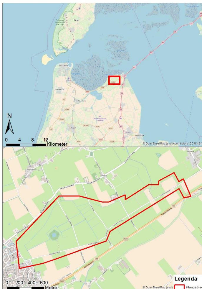
Figuur 2.1. Ligging van het plangebied

Het plangebied bestaat uit grasland dat voornamelijk een agrarische bestemming heeft. Een klein deel is in beheer van Staatsbosbeheer. Op het moment van het veldbezoek waren de graslanden op een aantal plaatsen gemaaid. Een deel van de graslanden wordt intensief beheerd. Binnen het plangebied bevinden zich enkele bomensingels, boerderijen en een eendenkooi. De watergangen binnen het plangebied hebben grotendeels een steile oever en zijn begroeid met algemene plantensoorten. In het water groeit op een aantal locaties watergentiaan, puntkroos en enkele algemene kroossoorten (welke de sloten deels bedekken). Op een aantal locaties is een rietkraag aanwezig langs de sloot. De duikers zijn watervoerend en op een enkele plek met een ruigte vegetatie begroeid (figuur 2.2, rechtsonder).