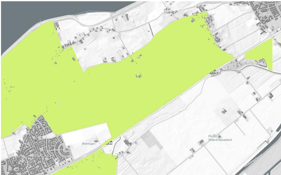
Figuur 4.3 Begrenzing weidevogelleefgebied (lichtgroen)