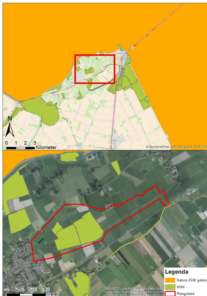
Figuur 4.1 Begrenzing van Natura 2000 gebieden en het Natuurnetwerk Nederland (NNN)