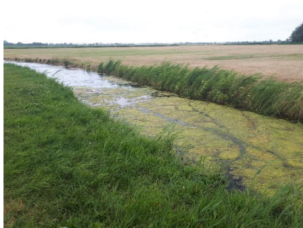
Figuur 2.2. Deze foto's geven een indicatie van de biotopen in het plangebied.