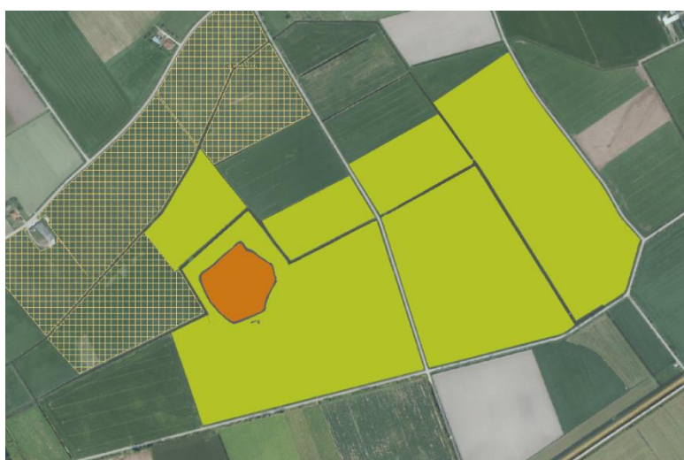
Figuur 4.2 Beheertypen binnen plangebied N12.03 Glanshaverhooiland (groen) en A02.01 Botanisch waardevol grasland (oranje raster) (Bron: Provincie Noord-Holland)