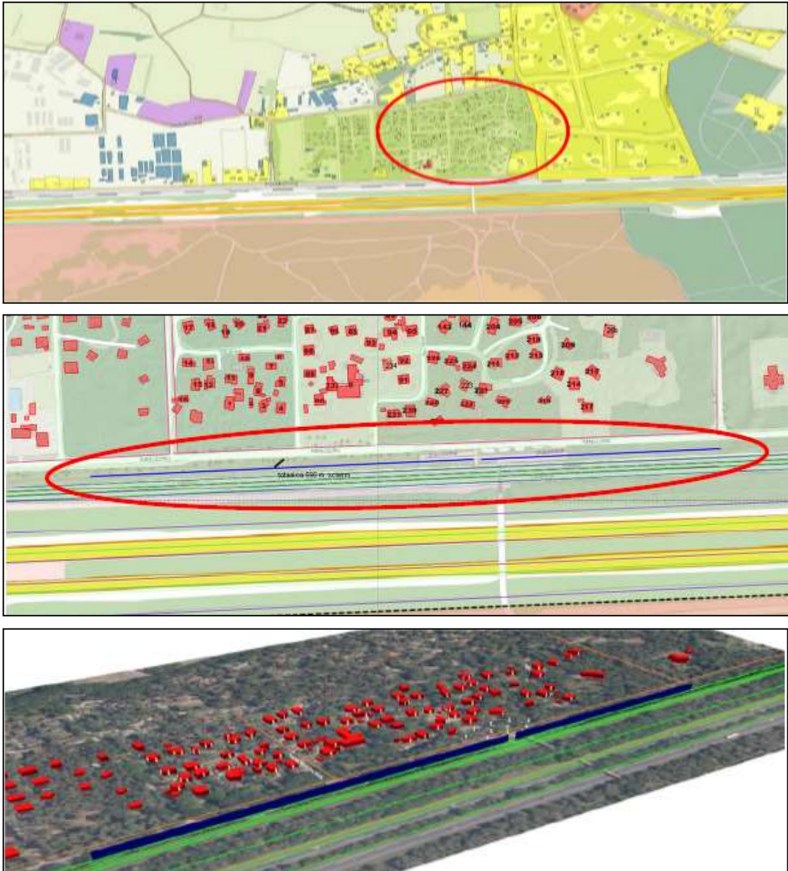
Figuur 1. De ligging van het plangebied (rood omcirkeld) aan de Parallelweg te Hierden (afbeelding boven). Op de middelste afbeelding is het te creëren geluidscherm weergegeven, in de berm tussen de Parallelweg en het treinspoor (groene lijnen). Op de onderste afbeelding is de situatie in 3D beeld weergegeven. De rode gebouwen betreffen de woningen op het park, het blauwe 'hek' weergeeft het geluidscherm, terwijl de groene lijnen de spoorlijn weergeven. Op de voorgrond is de snelweg A28 weergegeven.