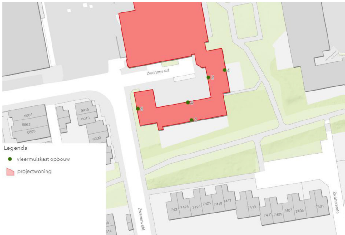
Figuur 2: locaties tijdelijke vloermuiskasten met groene stippen aangegeven (Loo Plan, 2020)