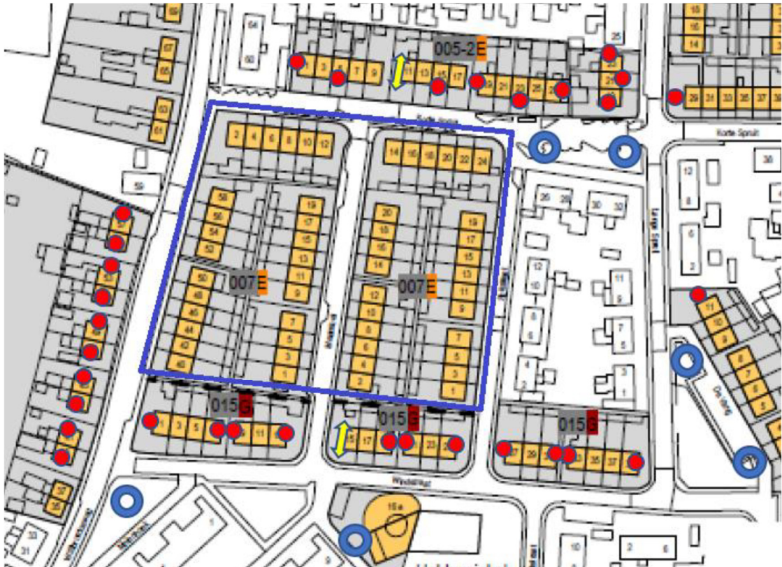
Figuur 2: locaties tijdelijke voorzieningen. De vloermuiskasten worden weergegeven in het rood, de huismustillen in blauw, de gele pijlen de locaties van de tijdelijke gierzwaluwkasten. Binnen het blauwe kader ligt het plangebied (Schilderman, 2021)