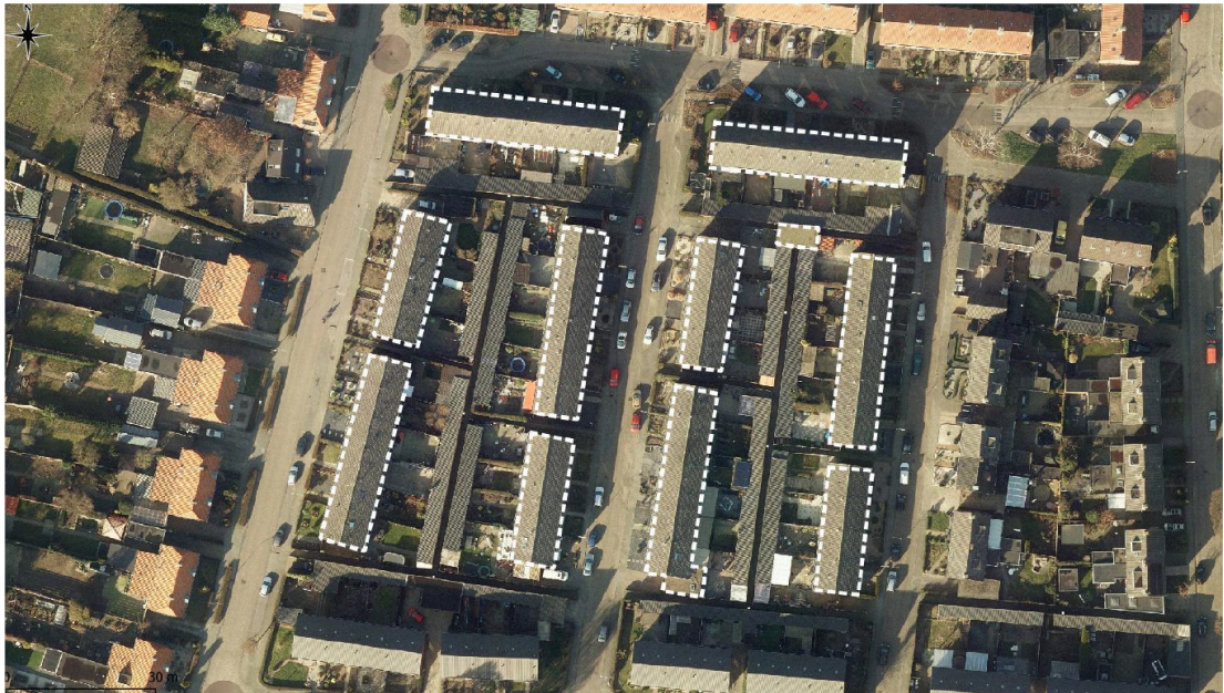
Figuur 1: Plangebied aangegeven binnen witte kader (Schilderman, 2020)