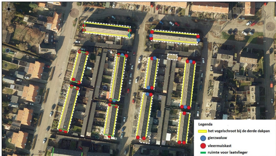
Figuur 3: locaties permanente voorzieningen. Vleermuiskasten worden aangegeven met rood, gierzwaluwkasten met blauw. De gele lijnen geven de locaties van het verhoogde vogelschroot en groen de kopgevels waar ruimte wordt gemaakt onder de kantpannen (Schilderman, 2020)