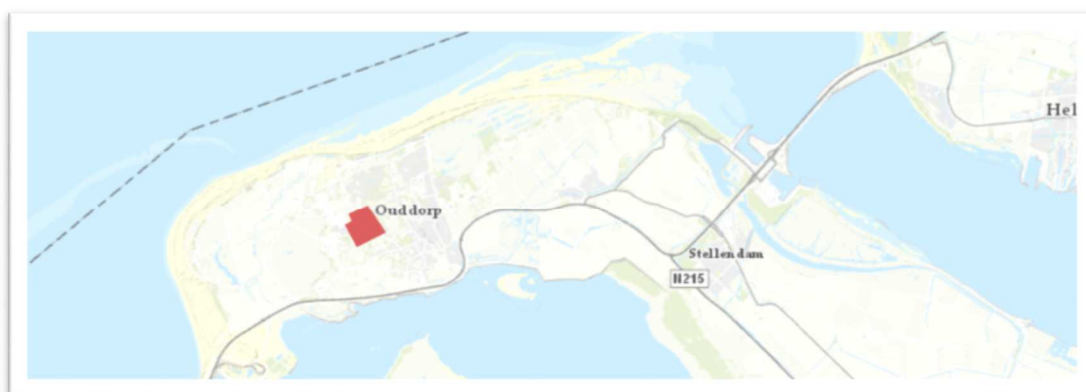
Locatie: Stelleweg 5 te Ouddorp