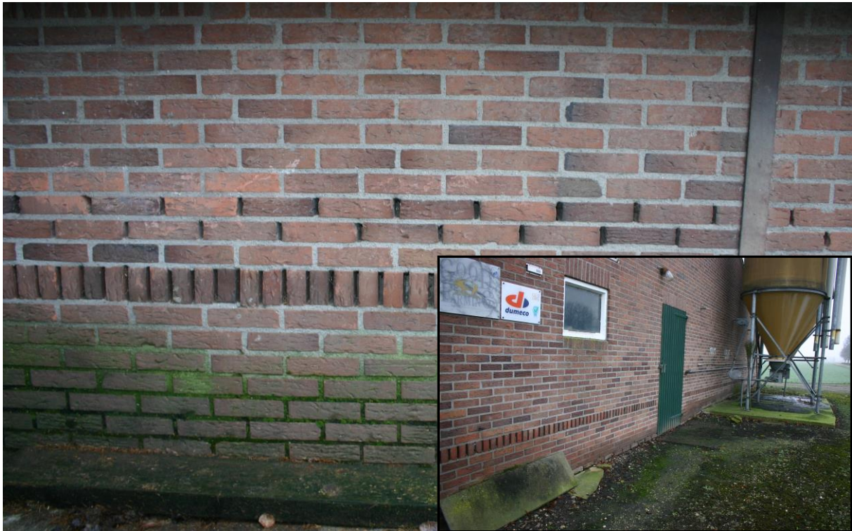
Figuur 4.2.2. De varkensstallen hebben een tochtige spouw, waardoor deze niet geschikt is voor vleermuisverblijven.

De langgevelboerderij zelf heeft geen spouw. Net als voor de gierzwaluwen, zijn de gevelpannen voor vleermuizen niet bereikbaar vanwege de gladde boeiboorden. De boeiboorden zelf sluiten strak aan op de gevels, dus ook hieronder is geen ruimte voor vleermuizen om weg te kruipen. De aanbouw met het platte dak (zie figuur 4.1.2) heeft wel spouw. De daktrim sluit echter strak op de gevel aan. De grote aanbouw (#4 in figuur 4.1.1 en figuur 4.2.3) heeft geen spouw, maar de boeiboorden kieren wel met de gevel (zie figuur 4.2.3). Het is mogelijk voor vleermuizen hier in te vliegen. Vleermuisverblijven kunnen hier dus aanwezig zijn. Ook overige algemene zoogdieren zoals de veldmuis kunnen in het plangebied voorkomen.