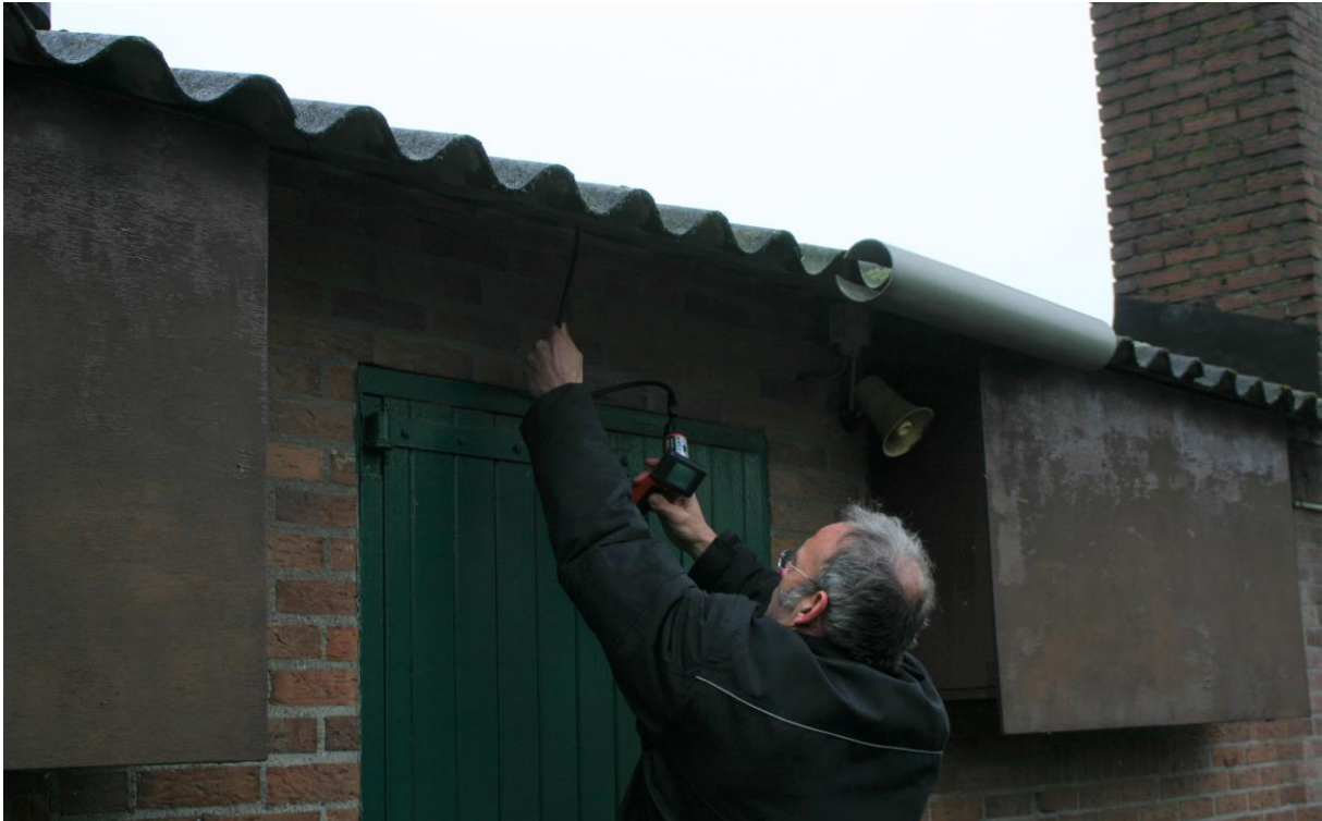
Figuur 4.2.1. De varkensstallen zijn met een boomcamera onderzocht op het voorkomen van steenuilennesten.

het broedseizoen algemene vogelsoorten als de merel in de opgaande vegetatie in het plangebied (gaan) broeden.