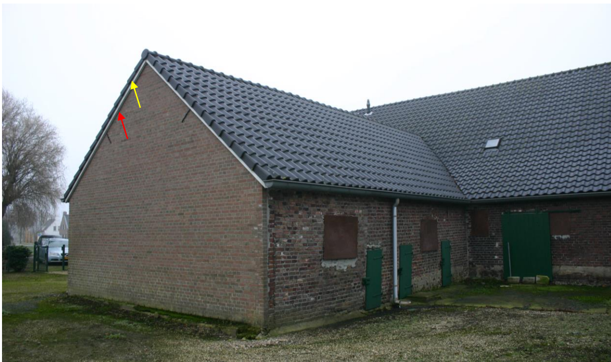
Figuur 4.2.3. De grote aanbouw aan de langgevelboerderij (4 in figuur 4.1.1) bevat mogelijk vleermuisverblijven. Er zijn diverse invliegopeningen tussen de gevel en boeiboorden (rode pijl). De ruimte tussen de gevelpanen en de boeiboorden (gele pijl) is niet bereikbaar vanwege de gladde boeiboorden.