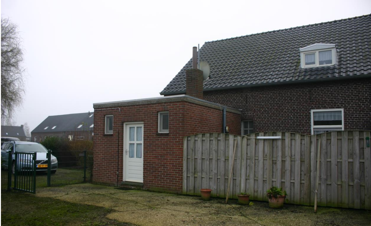
Figuur 4.1.2. Aanbouw met plat dak (3 in figuur 4.1.1).