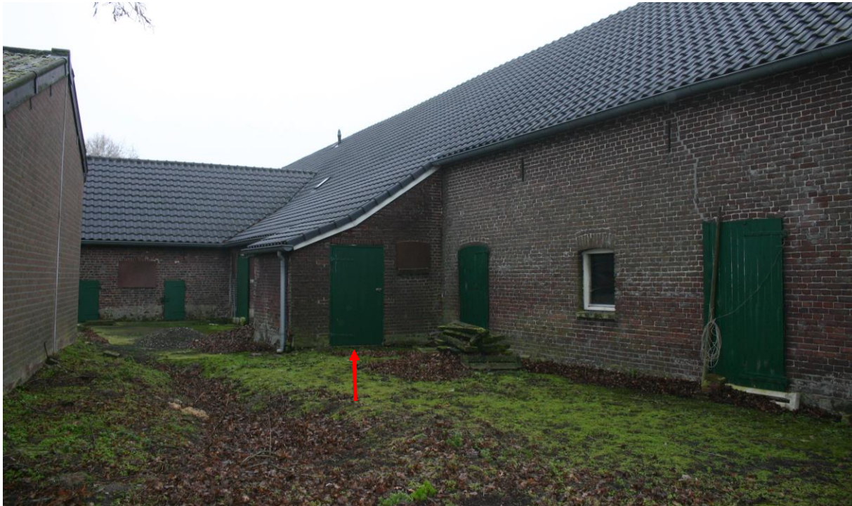
Figuur 4.1.4. De kleine aanbouw (rode pijl; 5 in figuur 4.1.1) aan de langgevelboerderij.