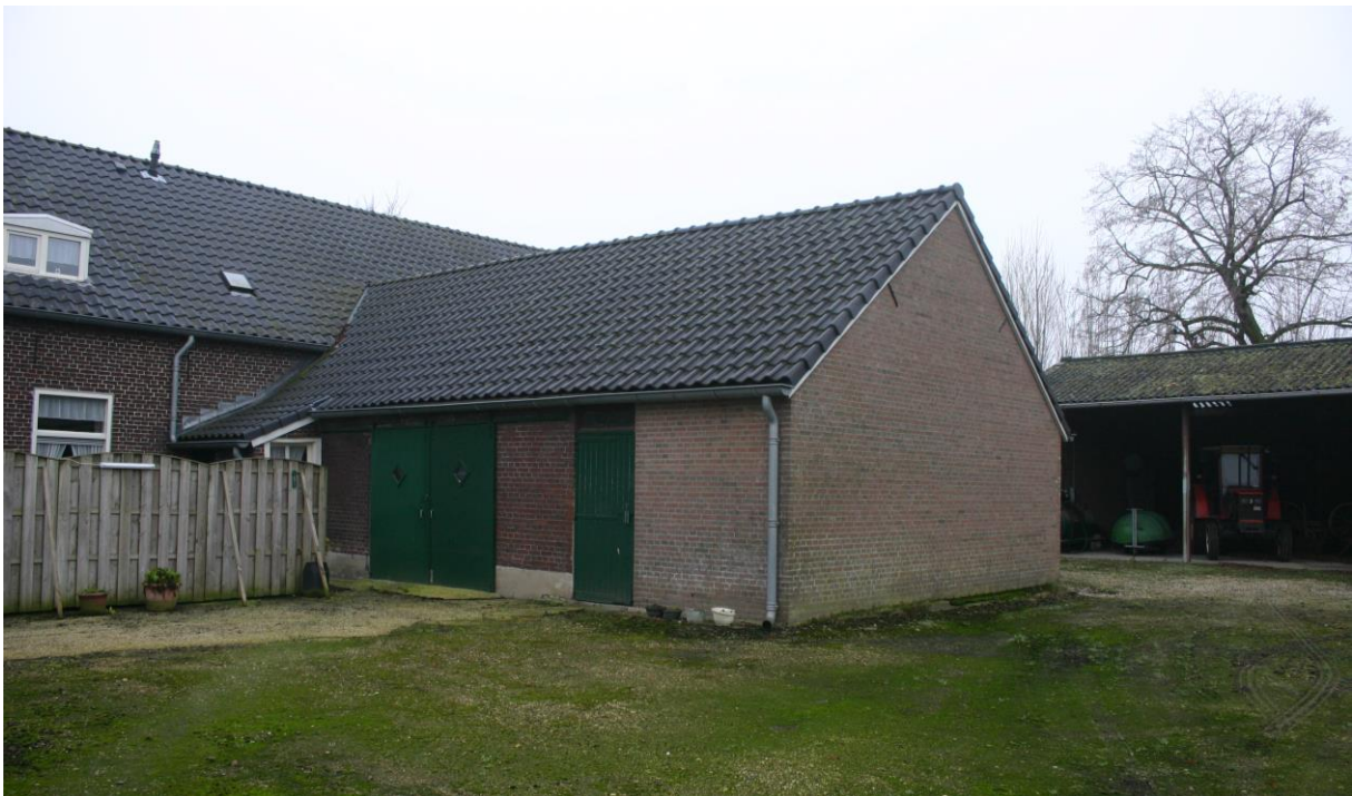
Figuur 4.1.3. Grote aanbouw (4 in figuur 4.1.1).