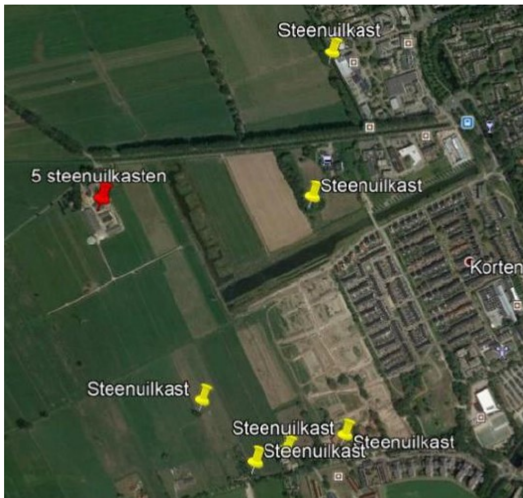
Figuur 2 Locaties van de 11 geplaatste steenuilenkasten.