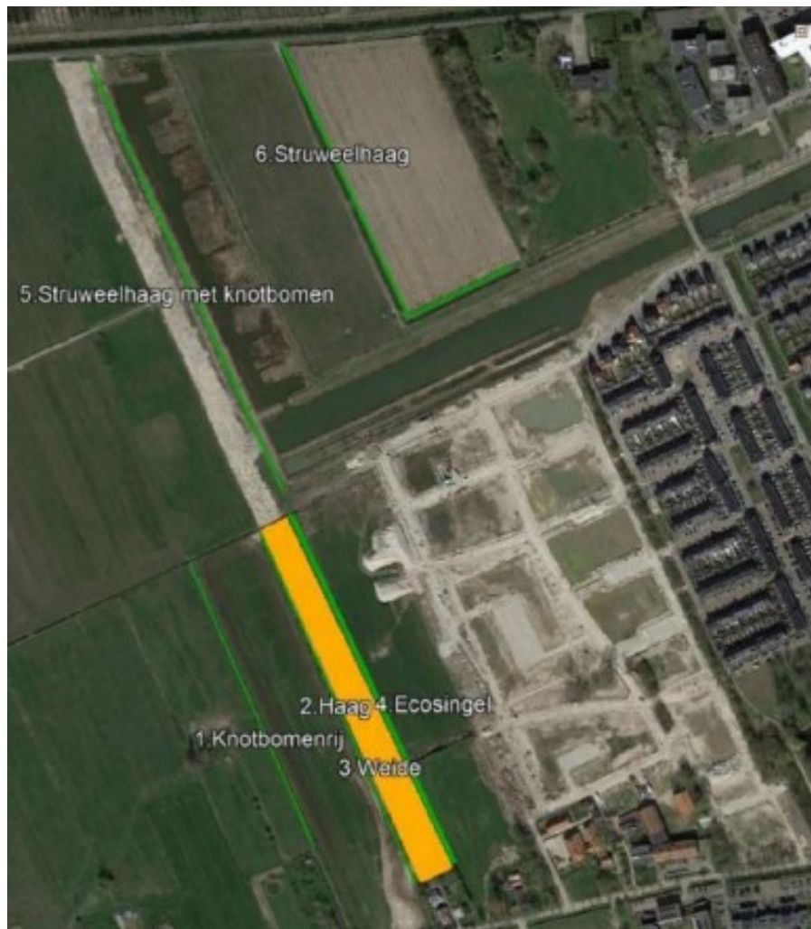
Figuur 3 Toelichting nummers 1-6 op de luchtfoto:

1. Knotbomenrij van 300 meter bestaande uit schietwilgen met een plantafstand van 8 meter. Deze knotbomenrij sluit aan op de bestaande beplanting op het erf van Haarweg 18. Onderhoud bestaat uit periodieke afzetting (ca. 3 - 5 jaar). Duur: permanent. Dit betreft terrein in beheer/eigendom van Van Vlastuin Agro.