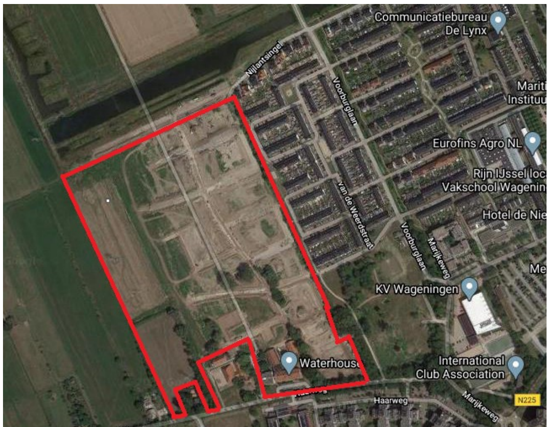
Figuur 1 Begrenzing plangebied (rood omkaderd).