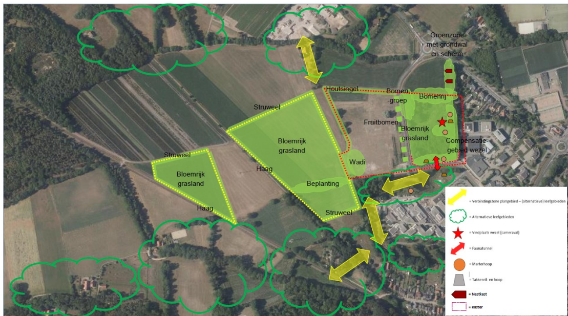
Figuur 3 Locaties van de mitigerende maatregelen voor de wezel in de vorm van een faunatuunnel (rode pijl), marterhopen (oranje cirkels), takkenrillen (grijze trapezia), nestkasten (donkerrode vijfhoekige pijlen), een raster (rode stippellijn), compensatiegebied en potentiële alternatieve leefgebieden (groene wolkvormige symbolen) (Wamelink, 2021).