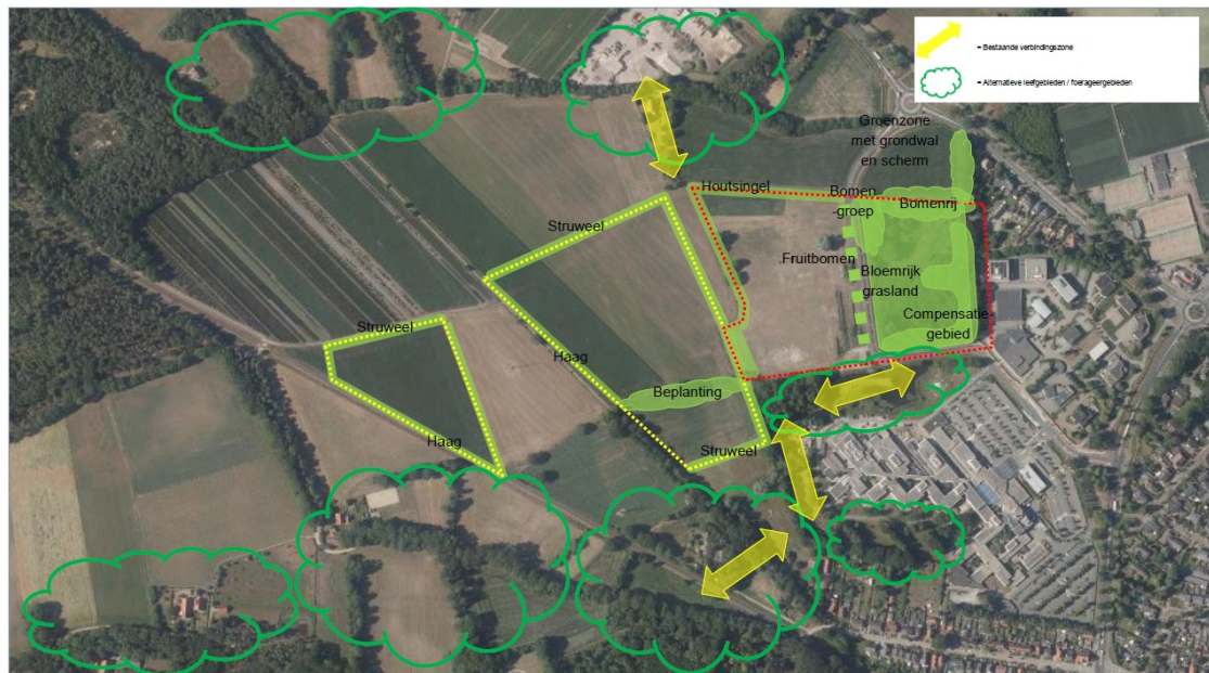
Figuur 5 Locaties van de mitigerende maatregelen voor de gewone dwergvleermuis in de vorm van compensatiegebied en potentiële alternatieve foerageergebieden (Wamelink, 2021).