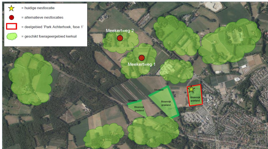
Figuur 2 Locaties van de mitigerende maatregelen voor de kerkuil in de vorm van potentiële alternatieve foerageergebieden en nestlocaties (Wamelink, 2021).