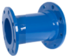
FF 100 L=300