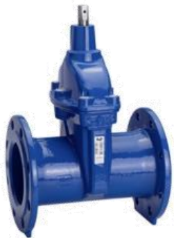
A .... = afsluiter