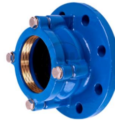
PE 110 TV