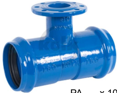
PA .... x 100