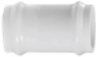
Mof .... overschuif