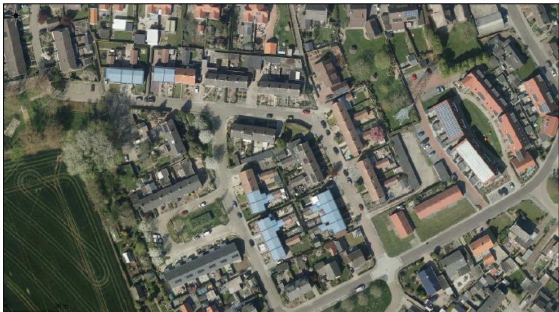
Figuur 1. Ligging en begrenzing van het plangebied aan De Hoge Wickstraat en Spanstraat te Oosterhout. Op de onderste afbeelding zijn de 15 te renoveren woningen voor dit project blauw gearceerd.