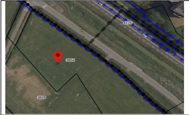
Figuur 1: Beoogde locatie