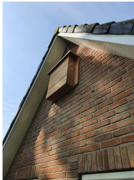
Figuur 2. Op beide kopgevels van de te behouden woning binnen het plangebied (blauwe stippen bovenste afbeelding) is voor gewone dwergleermuis een kraamkast geplaatst. In totaal zijn er dus twee kraamkasten opgehangen.