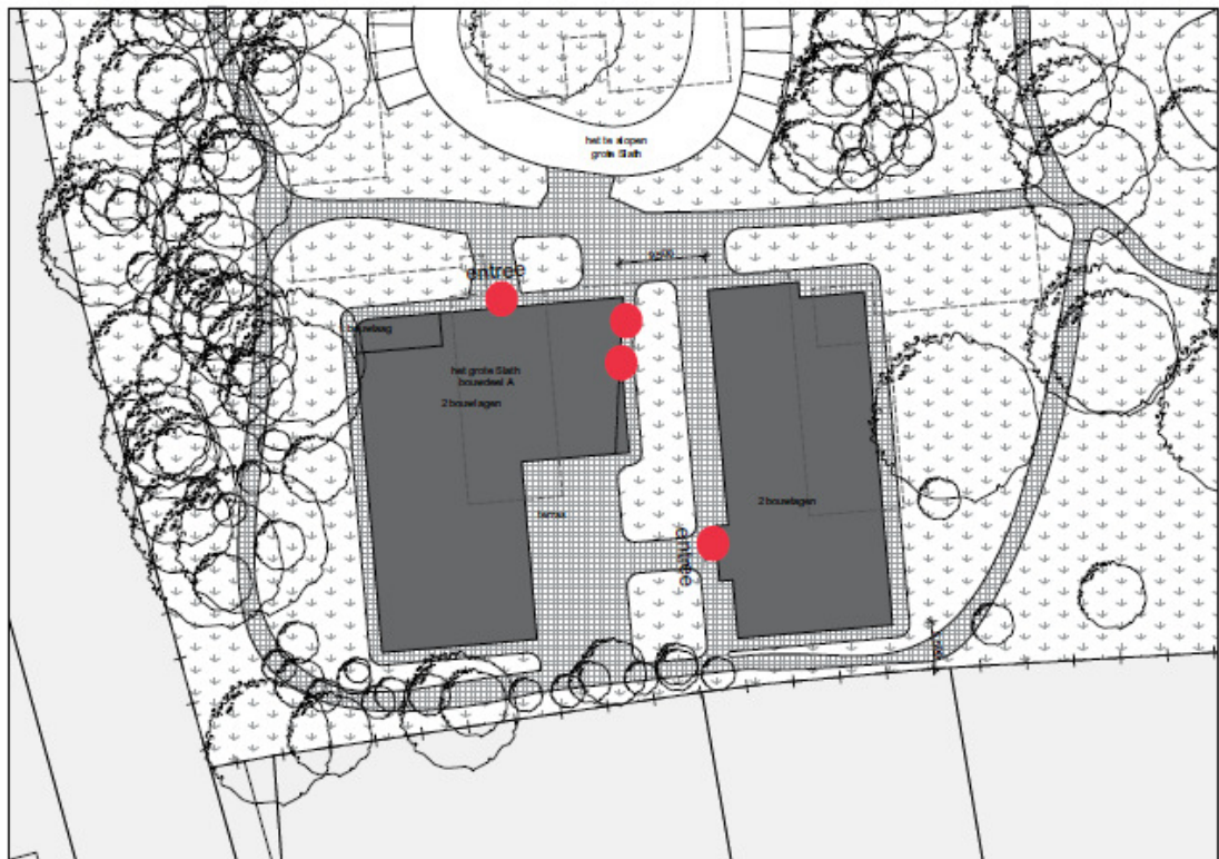
Figuur 2: Het nieuwe gebouw met de locaties voor de permanente verblijfplaatsen