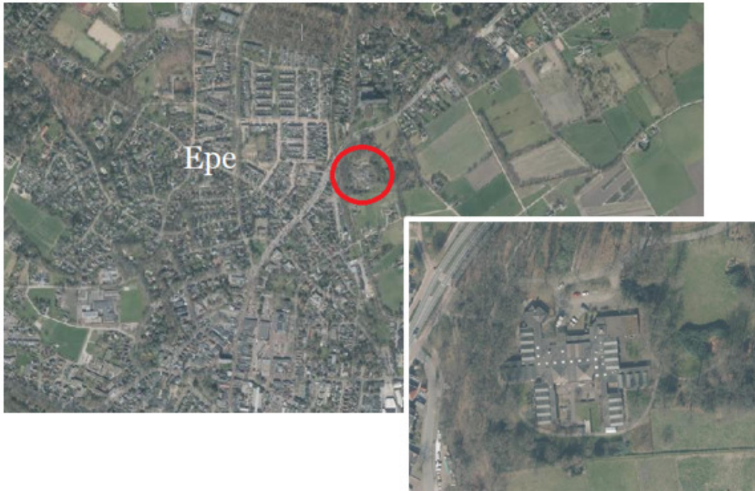
Figuur 1: Kaart projectgebied