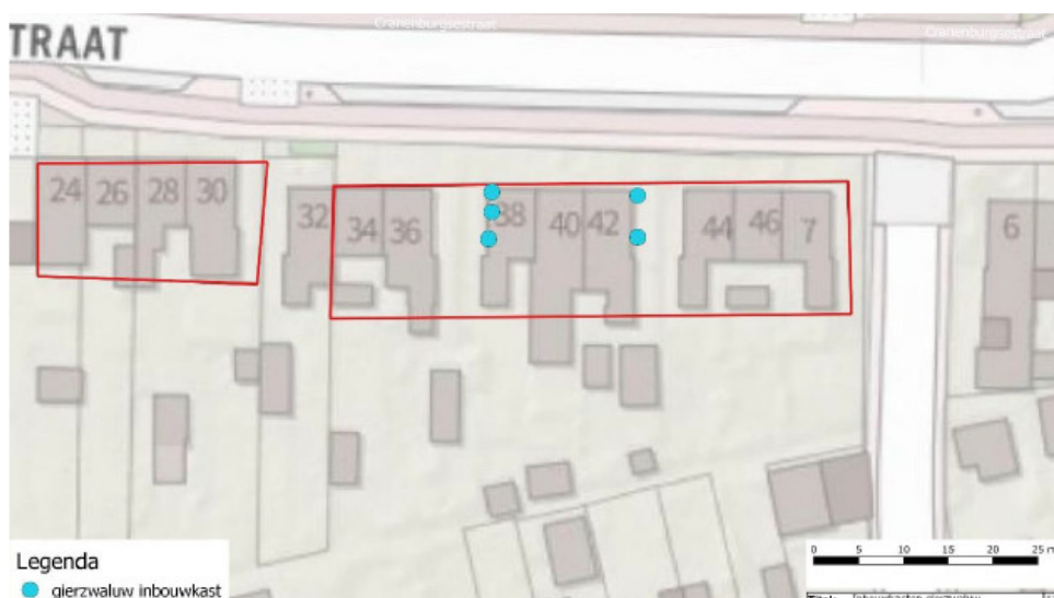
Figuur 3 Locaties van de permanente voorzieningen voor de gierzwaluw.