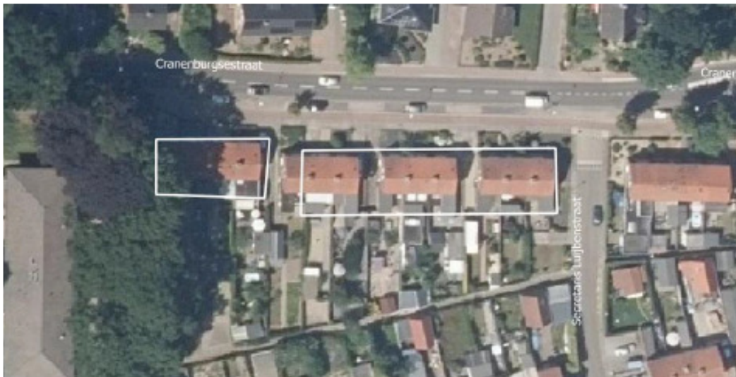
Figuur 1 Plangebied (wit omkaderd).