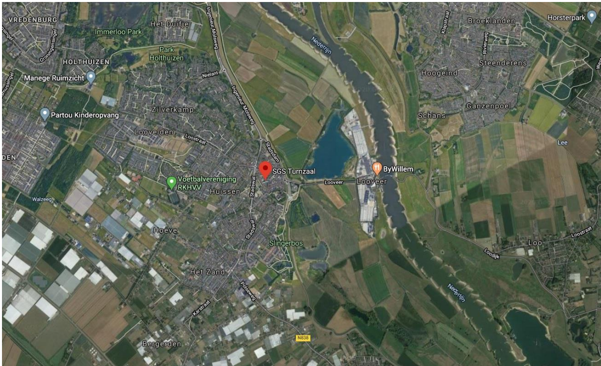
Globale ligging plangebied (rode druppel)