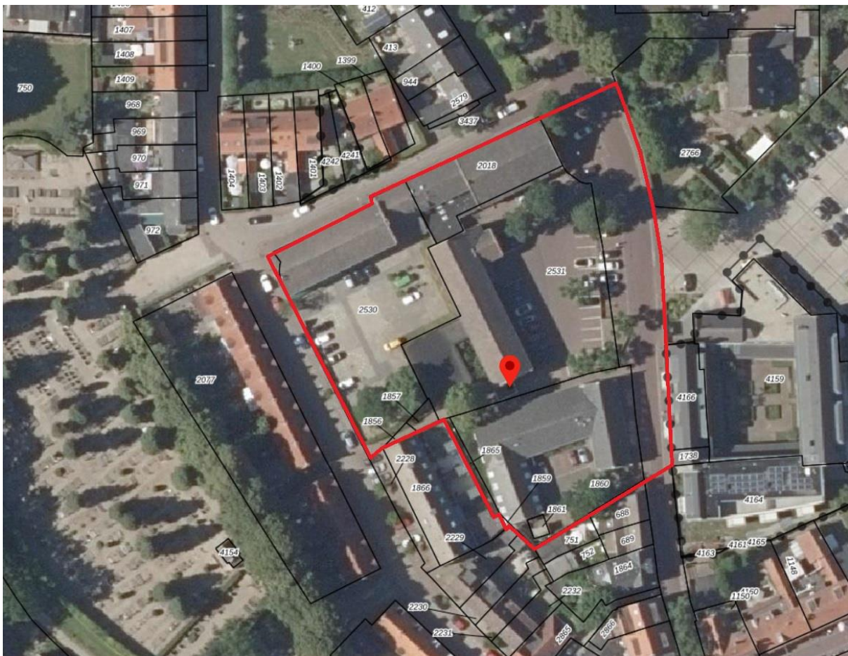
Globale begrenzing plangebied (rode omkadering)