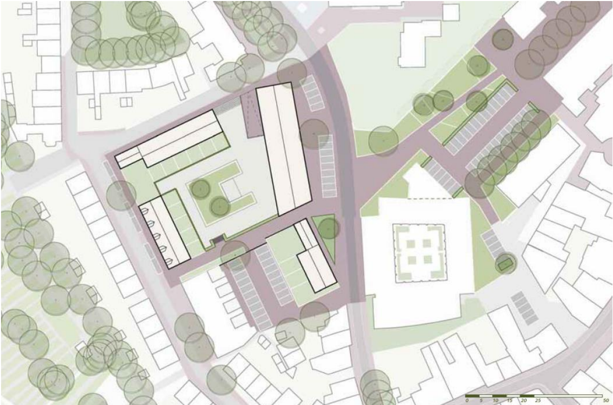
Overzicht voorkeursmodel 1