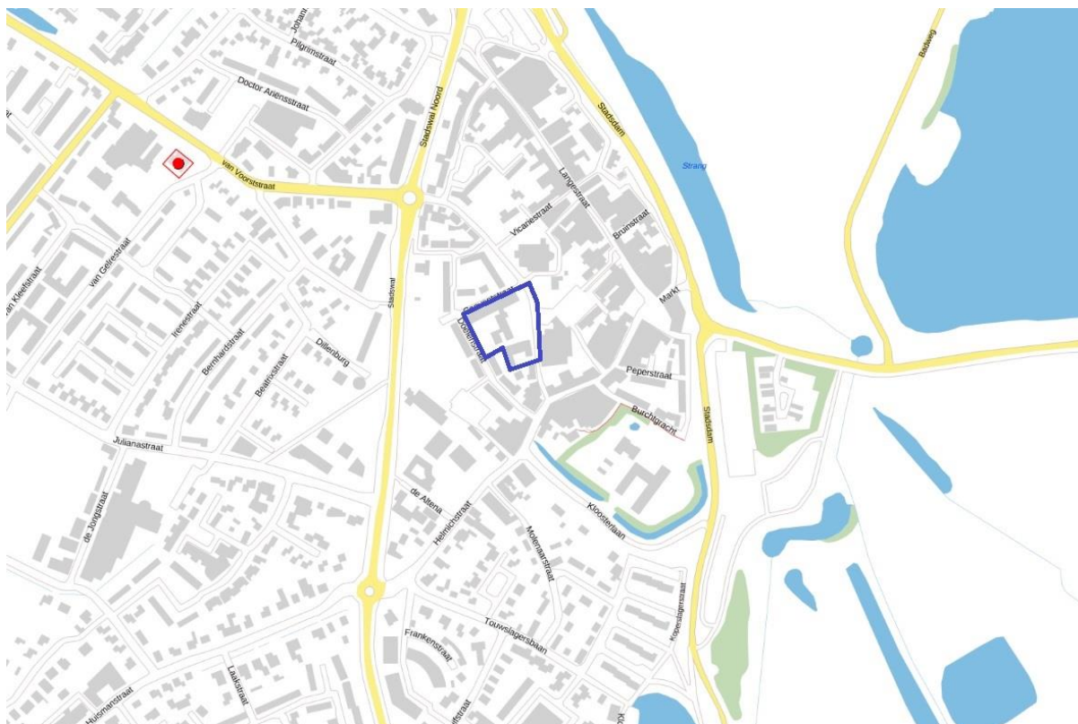
Uitsnede risicokaart met globale begrenzing plangebied (blauwe omkadering)

Er liggen geen inrichtingen of basisnetroutes en buisleidingen voor het transport van gevaarlijke stoffen (of het invloedsgebied daarvan) in de omgeving van het plangebied.