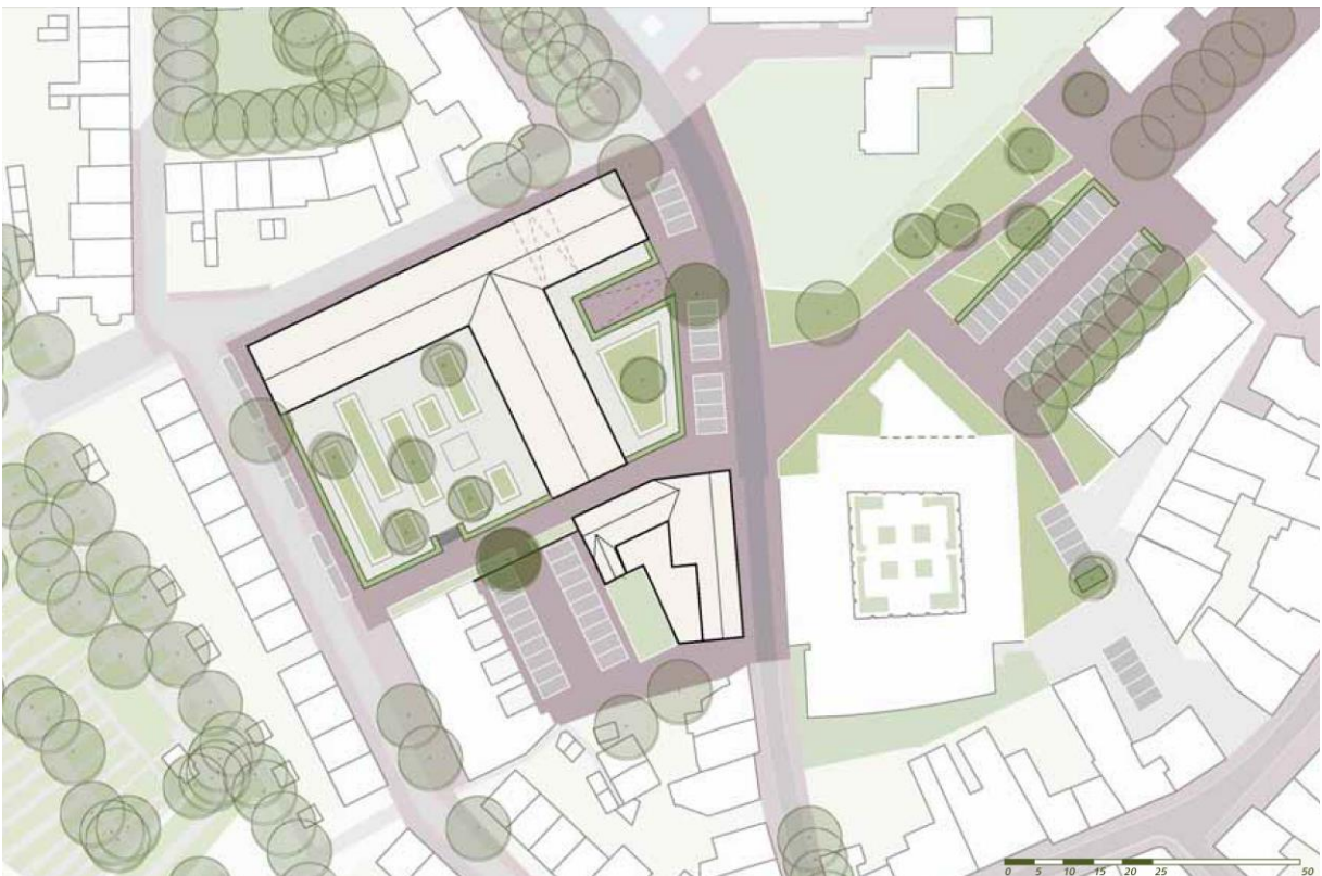
Overzicht voorkeursmodel 2

Dit model bestaat uit de realisatie van 30 woningen (gasloos en BENG-norm), verdeeld over 30 levensloopgeschikte appartementen. Op navolgende afbeelding is de ruimtelijke opzet van het model te zien: