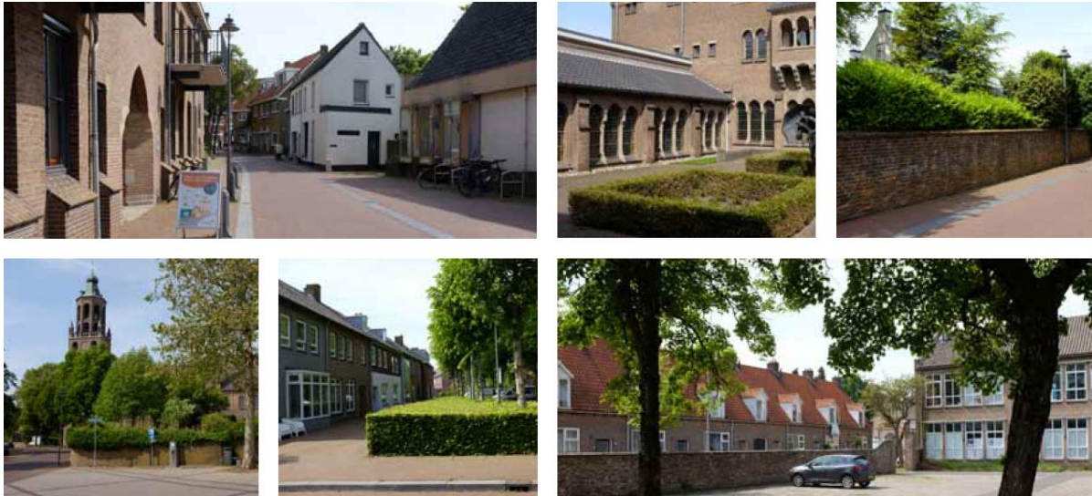
Impressie bestaande situatie in en om het plangebied

Parallel aan de Langestraat ligt de Langekerkstraat. Deze straat kent qua maat, schaal en architectuur in de binnenstad een andere opzet. Door de eeuwen heen huisvestte dit gebied meerdere katholieke instellingen die een nieuw soort ruimte met zich meebrachten, afhankelijk van de functie van de instelling. Deze grootschalige complexen, gelegen op ruime percelen, kennen een zekere alzijdigheid. De Langekerkstraat heeft hiermee een andere karakter dan de andere parallelle lijnen. Kleine volumes met langskappen laten zich afwisselen door grote volumes, die voorzien zijn van minimaal één markante haakse kap richting de straat. Kenmerkend voor de grote percelen is dat de gebouwen in het groen staan en vaak worden omsloten door een tuinmuur, waarmee de verspringingen in de rooilijn worden opgevangen en tevens wordt gezorgd voor een samenbindende openbare ruimte.