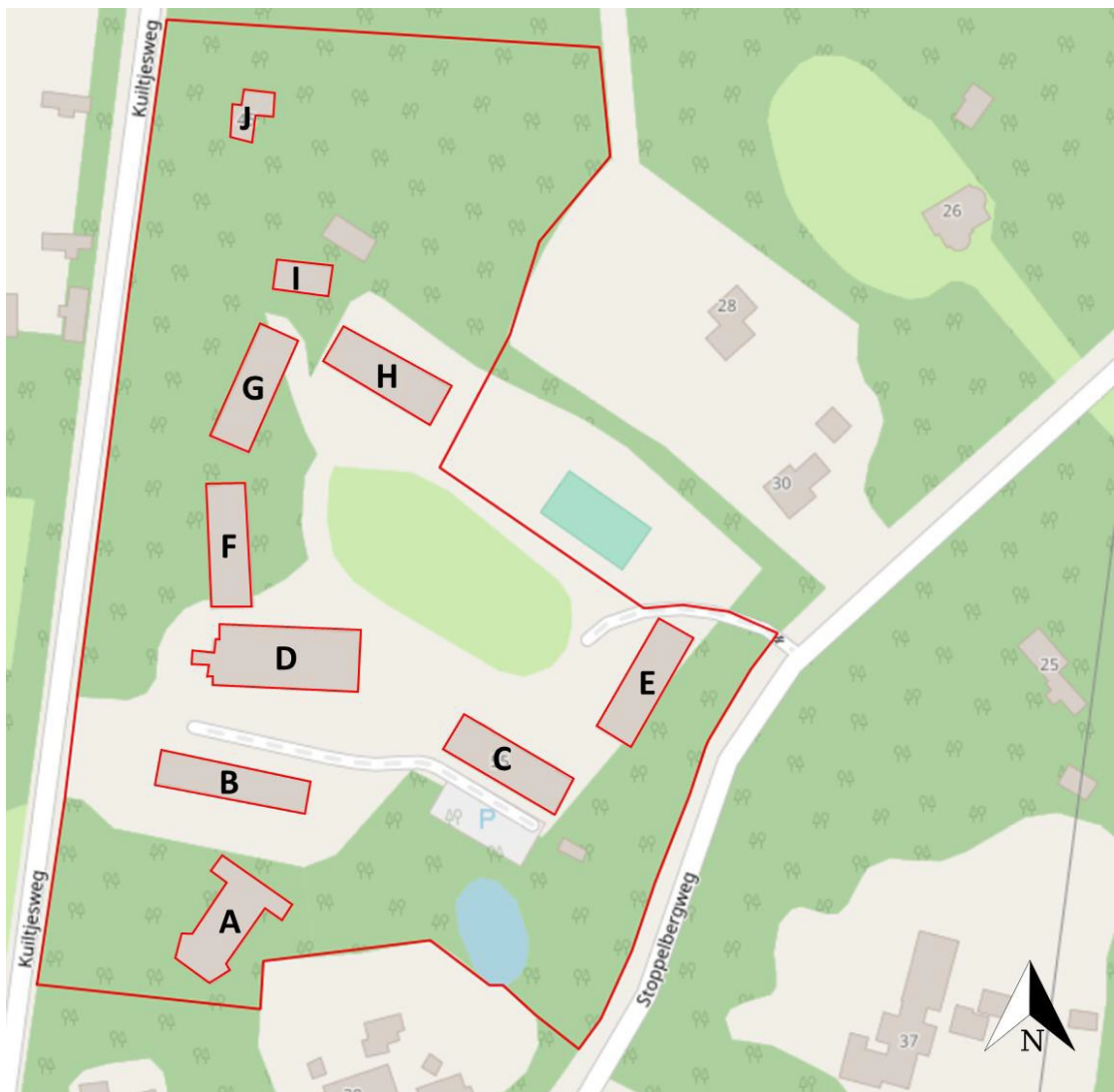
Figuur 1: Plangebied binnen rode kader (Brinkbaumer, 2021)