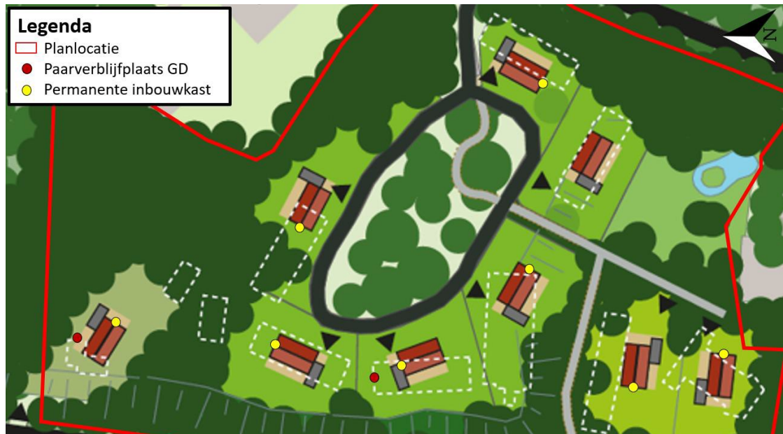
Figuur 3: locaties permanente inmetstelstenen met geel aangegeven (Brinkbaumer, 2021)