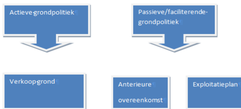
Tabel 2. Kostenverhaal bij actief vs faciliterend grondbeleid

Het voeren van faciliterend grondbeleid heeft vooral financiële voordelen, omdat geen risico's worden genomen (marktontwikkelingen, renteverliezen en dergelijke).