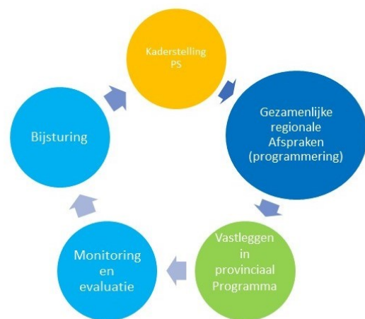
Regionale programmering is een continue proces

Voor 'werken' wordt de regionale programmering (vooralsnog) beperkt tot bedrijventerrein. Daarbij gaat het niet uitsluitend over nieuw bedrijventerrein, maar kan het ook gaan over herstructurering, verduurzaming en/of intensivering van bestaande terreinen. Als partijen dat wensen en er mee instemmen, kunnen aanvullend ook afspraken worden gemaakt over andere werklocaties.