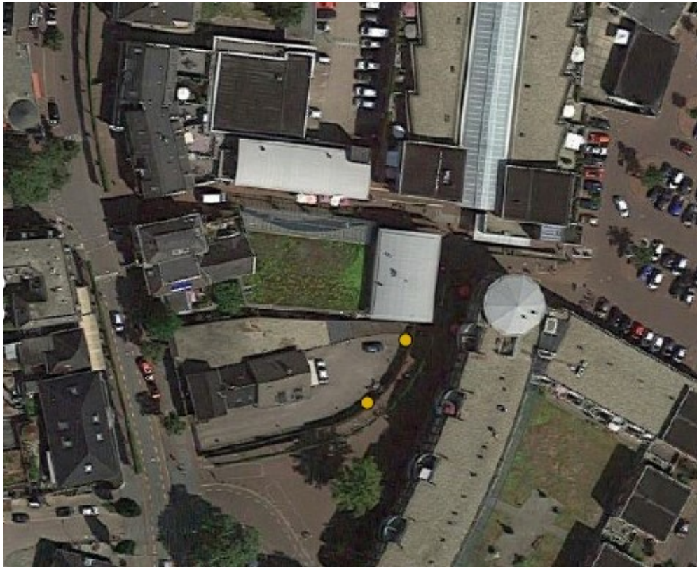
Figuur 2: locaties tijdelijke paalkasten aangegeven met gele stippen (Wegerif, 2020)