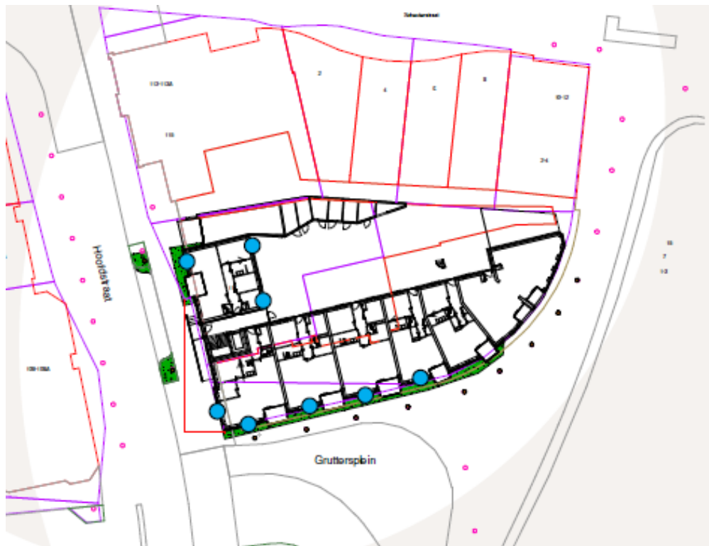
Figuur 3: locaties permanente voorzieningen in de nieuwbouw (Wegerif, 2020)