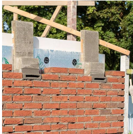
Figuur 3. Links: Inbouwkast Vivara Pro, IB VL 08. Rechts: Voorbeeld in bouwkast in buitenmuur. (Vivara Pro, 2021).

De permanente verblijfplaatsen worden zo dicht mogelijk bij de te compenseren verblijfplaats gerealiseerd. De inbouwkasten worden op verschillende locaties, op verschillende windrichtingen in de gevelmuur van de twee westelijke gebouwen op de west- en zuidkant ingemetseld. Op de verschillende locaties worden aaneengeschakelde kasten toegepast, in groepen van twee of drie. In de schachten heerst een stabiel klimaat, dat alleen per seizoen verschillend is (in de winter zal het kouder zijn dan in de zomer). Daarnaast worden de inbouwkasten op voldoende hoogte ingemetseld (maximaal binnen een meter onder de dakrand en op minimaal 4 meter hoogte) waarbij rekening gehouden wordt met een ruime aanvliegruimte. De inbouwkasten worden niet boven ramen geplaatst.