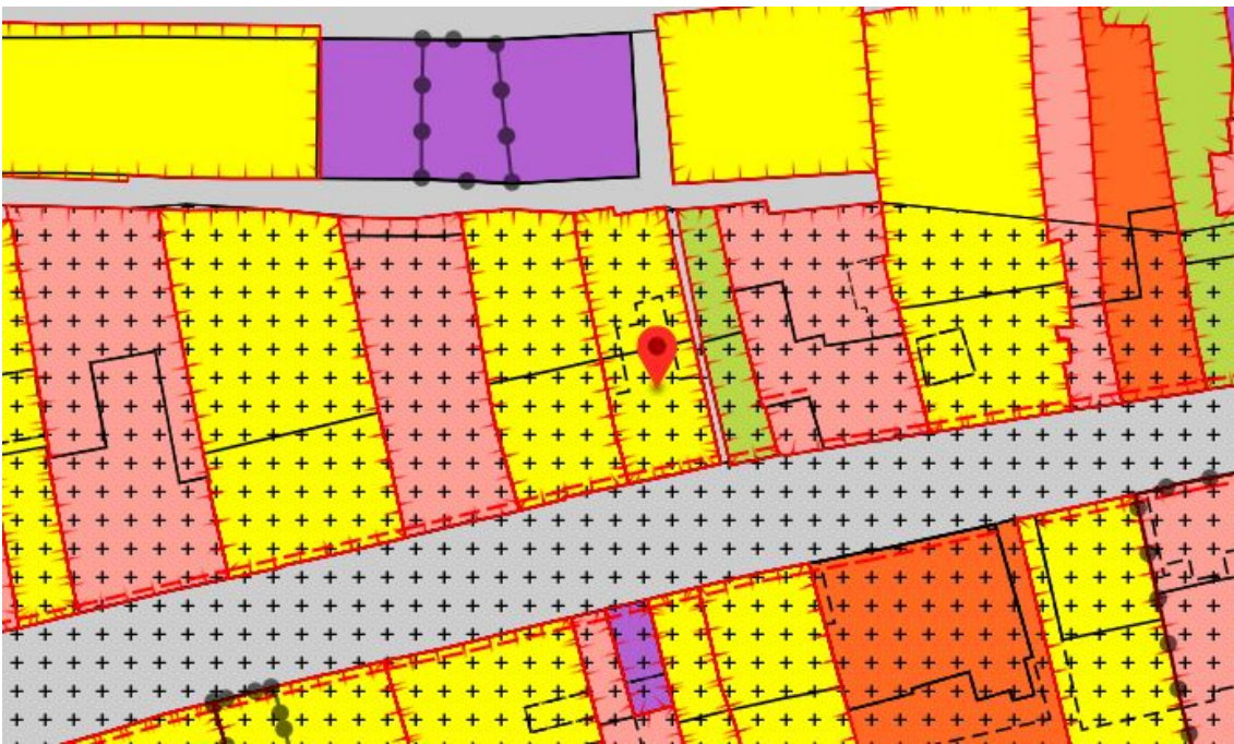
Figuur 2.1 Uitsnede Bestemmingsplan

Het adres Dorpsstraat 30 valt onder het bestemmingsplan 'Bestemmingsplan Vlieland kom' en op het adres ligt de enkelbestemming 'Wonen - 2'. Daarnaast ligt op het adres de gebiedsaanduiding 'wro-zone - wijzigingsgebied 7.2', binnen deze wijzigingsbevoegdheid ligt besloten de bevoegdheid het adres te voorzien van de aanduiding 'detailhandel'. Het gaat dan om een wijzigingsbevoegdheid die bestaat binnen de bestaande bebouwing.