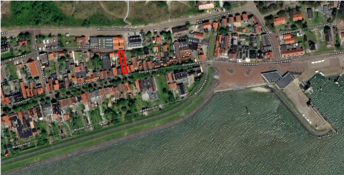
Figuur 1.1 Ligging Plangebied