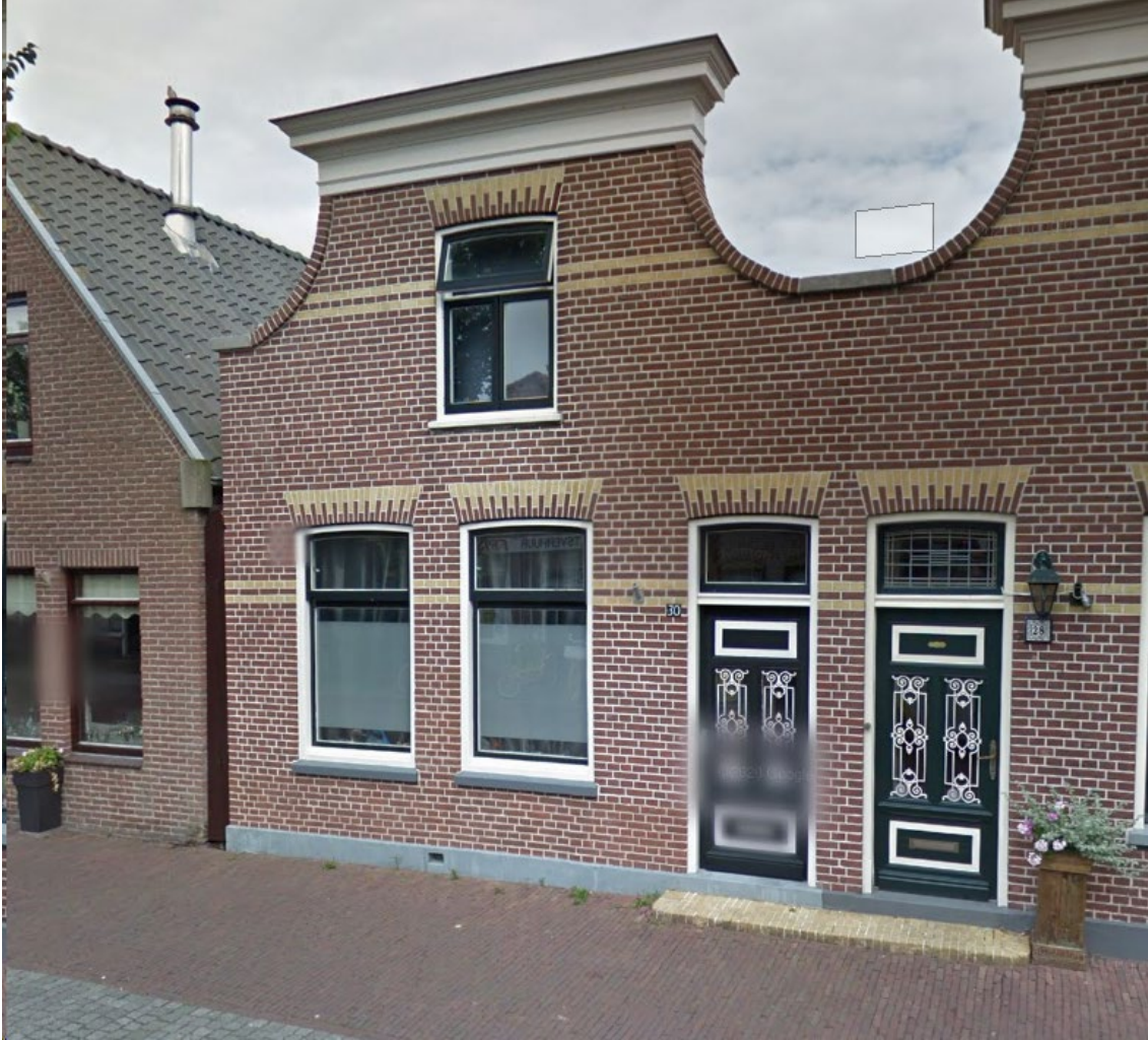
Figuur 1.2 Aangezicht Dorpsstraat 30