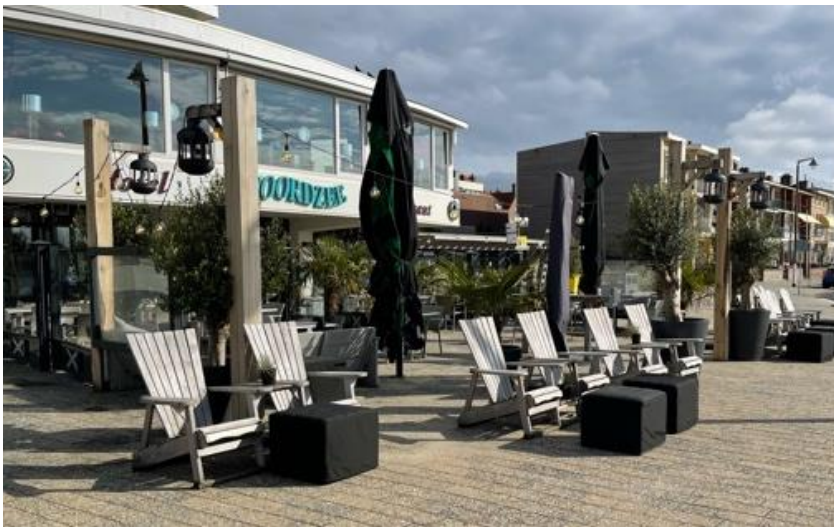
Impressiefoto, palen worden gebruikt om verlichting aan te hangen.