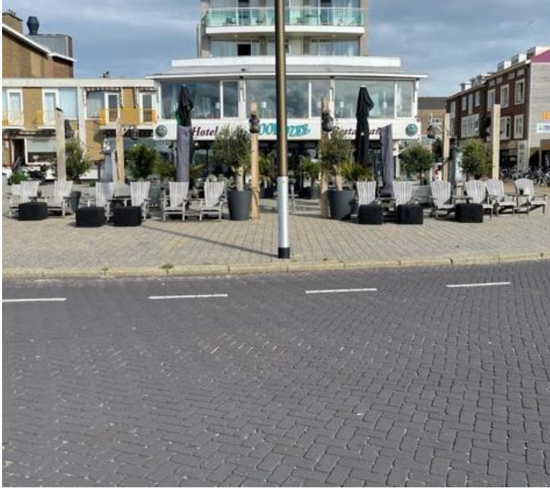
Vooraanzicht, zichtbaar vrije voetgangersruimte op de stoep. Symetrie palen ten opzichte van het pand.