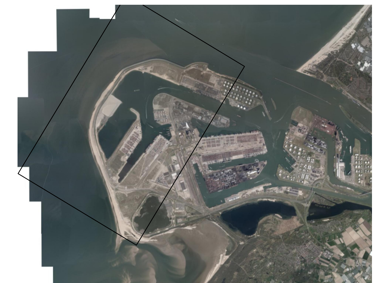
Overzichtskaart Schaal: 1:75.000