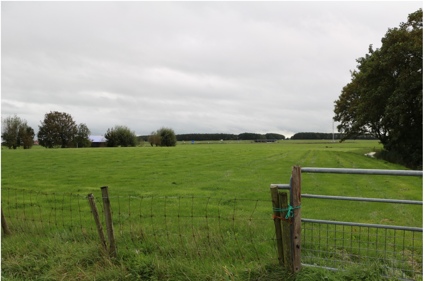
Kruinig perceel bij Dongjum