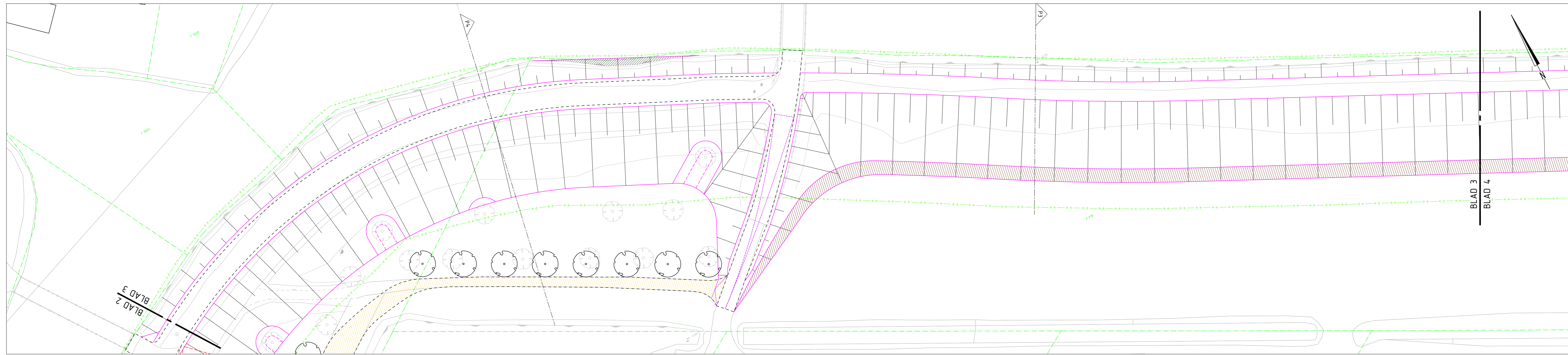
Blad 3 - Fase 3 en 4