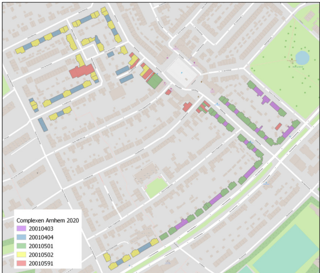
Figuur 1: Ligging plangebied Middenweg e.o. Geitenkamp te Arnhem.