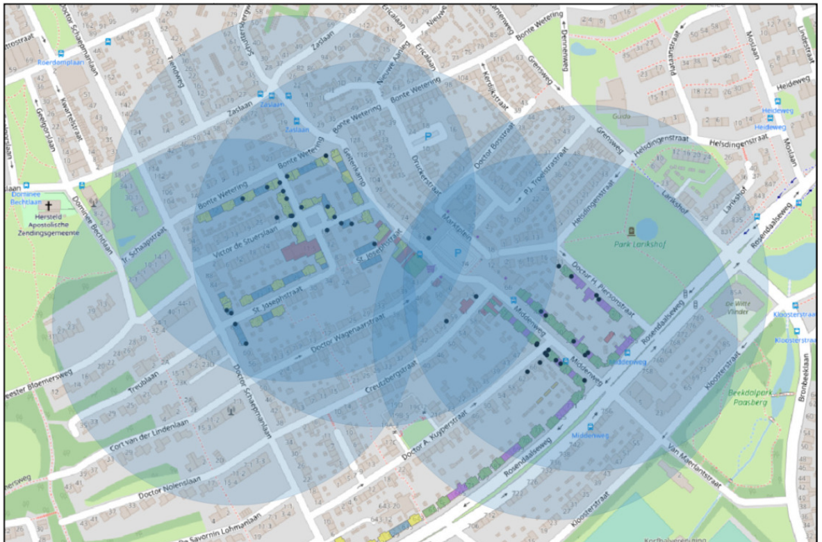
Figuur 2. Buffer van 200 meter waarbinnen de tijdelijke huismuskasten zijn aangebracht.