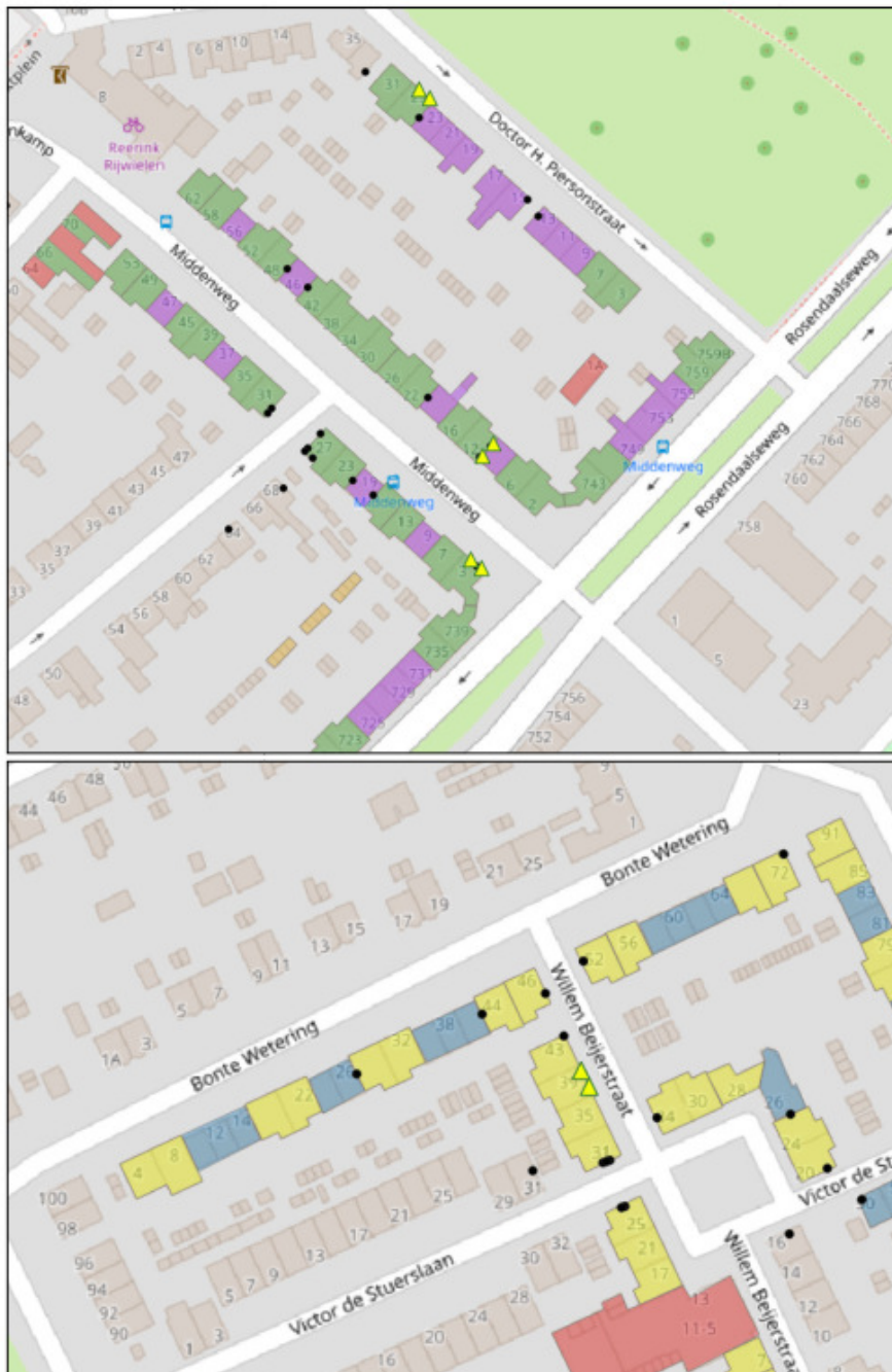
Figuur 4. Locaties aan te brengen permanente huismuskasten – gele driehoeken.