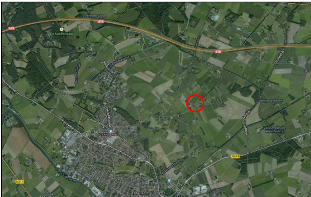
Figuur 1. Topografische ligging planlocatie (rode cirkel).

In figuur 1 is de topografische ligging van de locatie weergegeven.