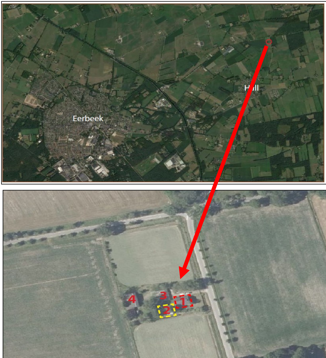
Figuur 1. De ligging van het plangebied aan de Hallsedijk 3 te Hall (bovenste afbeelding) en de (te slopen) opstallen. 1 = huidige te slopen woning. 2 = nieuw te realiseren woning. 3 = te behouden garage. 4 = te behouden kapschuur.