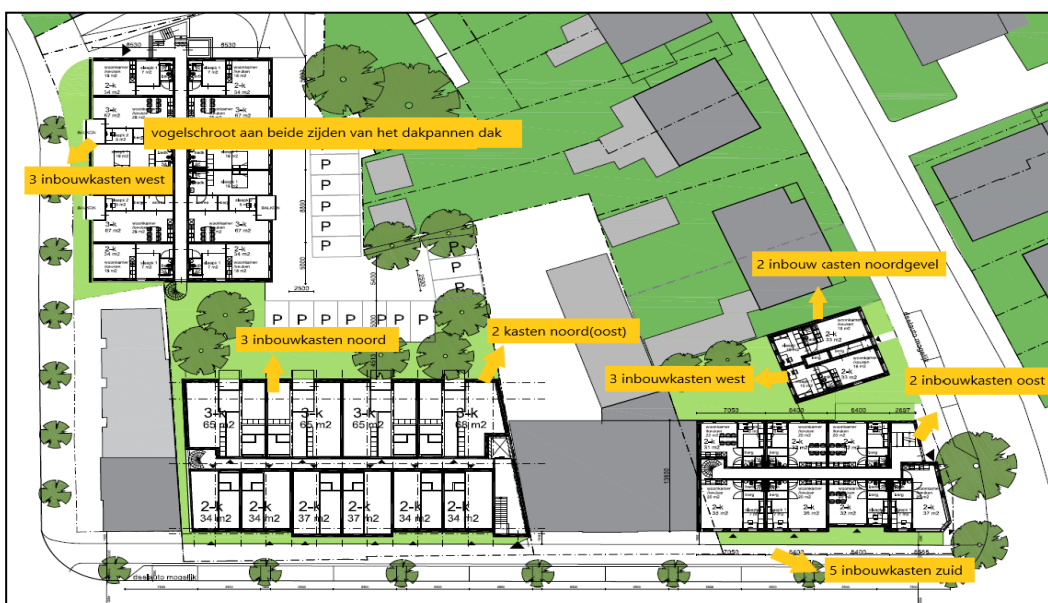
Figuur 2. De locaties van 13 vleermuis kasten (Chillon van Vivara Pro) en 2 kraamkasten, blauwe stippen met in cijfers het aantal kasten per locatie, afbeelding boven. De tabel weergeeft de locaties van 6 huismuskasten (NK MU 08, Vivara Pro) en 5 extra vleermuis kasten (VK WS 02, Vivara Pro). Op de onderste afbeelding zijn de permanente voorzieningen in de nieuwe situatie weergegeven. Dit betreft voor vleermuisen gecombineerde inbouw kasten van het type IB VL 05 en IB VL 06 van Vivara Pro en voor huismus betreft dit verhoogd vogelschroot langs de volledige zijden van het dak aan de Spelstraat 2-4.