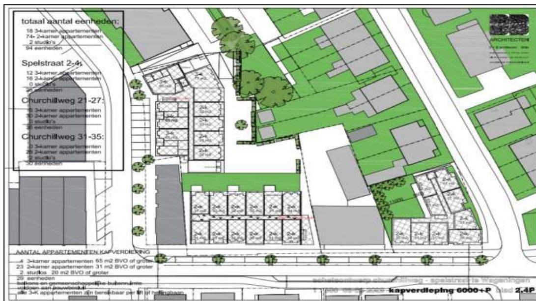
Figuur 1. Ligging van het plangebied (rood omlijnd) aan de Spelstraat 2-4, Churchillweg 23-25, 27 en 31-35 (afbeelding boven). Het terrein wordt ontwikkeld tot een nieuw appartementencomplex met 90 appartementen inclusief parkeerplaatsen (afbeelding onder).