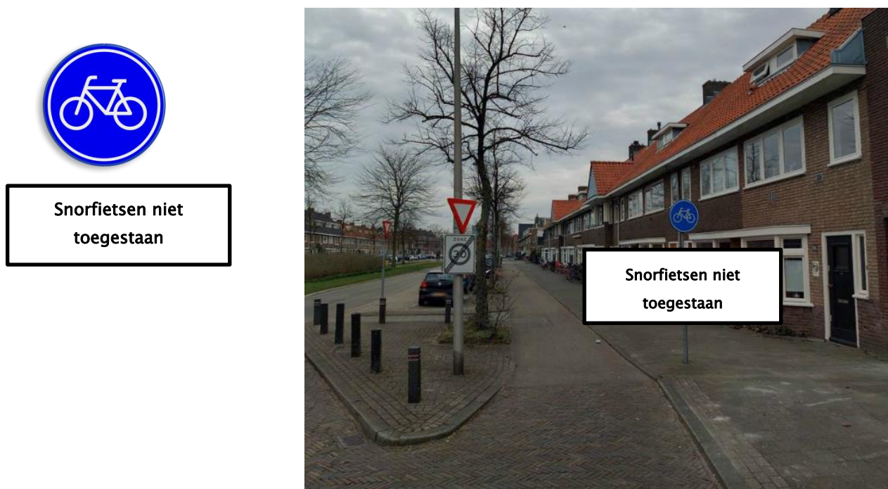
Afbeelding 1: Voorbeeld bebording, locatie Rijnlaan

Praktisch gezien betekent dit dat onder ieder G11, op fietspaden waar snorfietsers niet meer mogen rijden, een onderbord komt met "snorfietsen niet toegestaan". Dit wordt herhaald bij elke zijstraat.