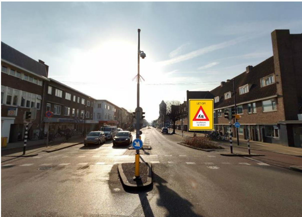
Afbeelding 2: Voorbeeld waarschuwingsbebording, locatie Marnixstraat – Amsterdamsestraatweg

Deze methode is ook bij het invoeren van Brommers naar de rijbaan gehanteerd. Er zijn toen geen negatieve meldingen over de bebording binnengekomen.