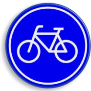
Bebording bij fietspaden waar snorfietsers wel mag rijden: G11

Voor een aantal wegen geldt er een uitzondering: hier blijven snorfietsers op het fietspad. Deze fietspaden worden aangegeven met een G11. Er komt geen onderbord te hangen welke aangeeft dat snorfietsers hier dan wel mogen. De gemeente Utrecht wil zo min mogelijk overbodige borden plaatsen. Dit is vanuit milieu overwegingen, maar ook omdat de maatregel voor een beperkt gebied in Utrecht wordt ingevoerd. Indien er op de uitzonderingswegen binnen het aangewezen gebied wel onderborden geplaatst gaan worden, moet er voor de volledigheid ook buiten het gebied borden komen. Dit gaat om heel veel borden. Een wildgroei aan borden draagt bovendien niet bij aan de leesbaarheid voor de verkeersdeelnemers.