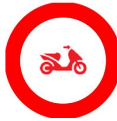
C1 met logo snorfiets