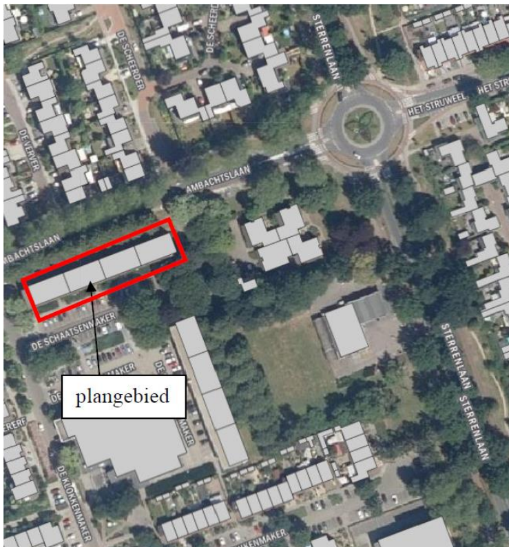
Figuur 1. Locatie plangebied Ambachtslaan - Klokkemaker

In onderstaande figuur is de situering van het bouwplan opgenomen.