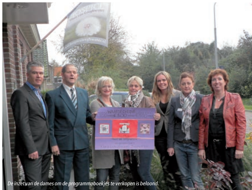
De inzet van de dames om de programmaboekjes te verkopen is beloofd.

Een collecte voor het hospice Thuis van Leeghwater heeft € 4.578,85 opgeleverd. Daar kwam nog eens € 500,- bovenop van de commissie Kortebaandraverij Beemster.