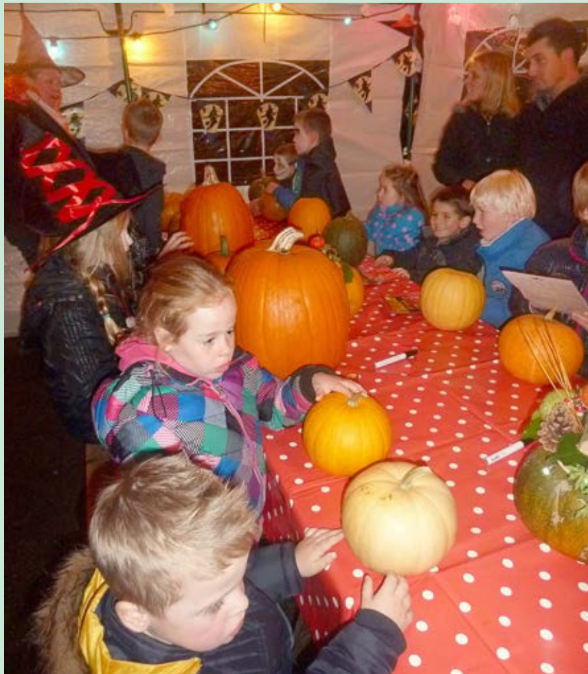
Het was een geslaagd Halloween-feest voor alle kinderen uit de straat.

Buurtvereniging Westerhem heeft op vrijdag 1 november voor het eerst een Halloween-feest gehouden. Het was een groot succes.