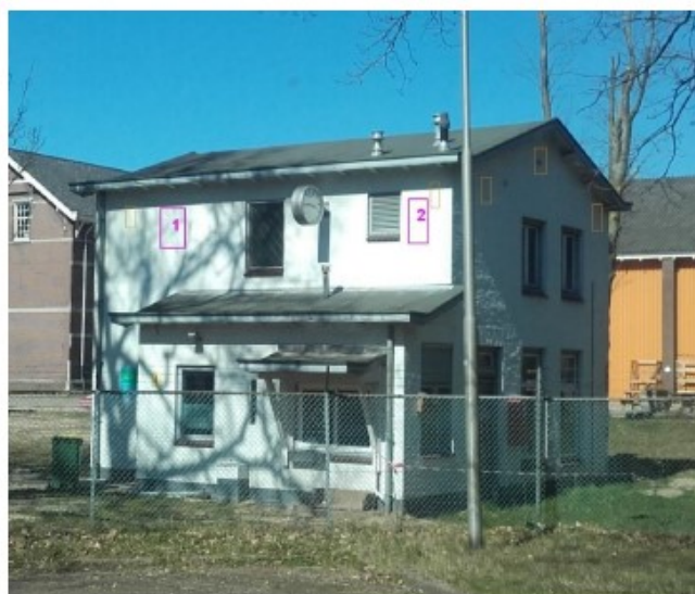
Foto 1. Zuid- en oostkant van de witte villa. De oranje vierkantjes weergeven de locaties van de open geboorde stootvoegen in de spouwmuur. De paarse vierkantjes weergeven geschikte locaties waar vleermuiskasten geplaatst kunnen worden.