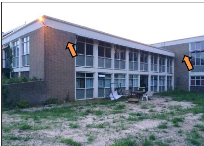
Figuur 2. Het gebouw Heidebrouwerij, met daarin reeds jaren een kraamverblijfplaats van gewone dwergvleermuizen. Twee invliegopeningen zijn aangegeven (oranje pijlen), de derde valt rechts buiten beeld op de punt van het gebouw.