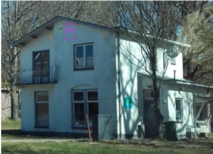
Foto 2. Westkant van de witte villa. De oranje vierkantjes weergeven de locaties van de open geboorde stootvoegen in de spouwmuur. De paarse vierkantjes weergeven geschikte locaties waar vleermuiskasten geplaatst kunnen worden.