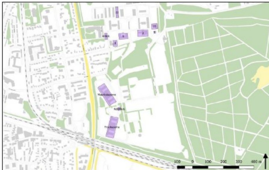
Figuur 3. Naamgeving en nummering onderzoeksgebied vleermuizen Parklaan en kazerneterreinen 2018. Gebouw 1 betreft de witte villa.