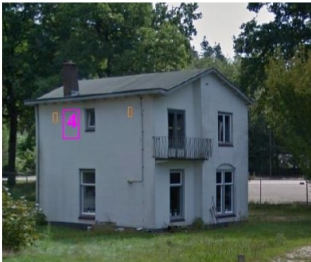
Foto 3. Noordkant van de witte villa. De oranje vierkantjes weergeven de locaties van de open geboorde stootvoegen in de spouwmuur. De paarse vierkantjes weergeven geschikte locaties waar vleermuiskasten geplaatst kunnen worden.