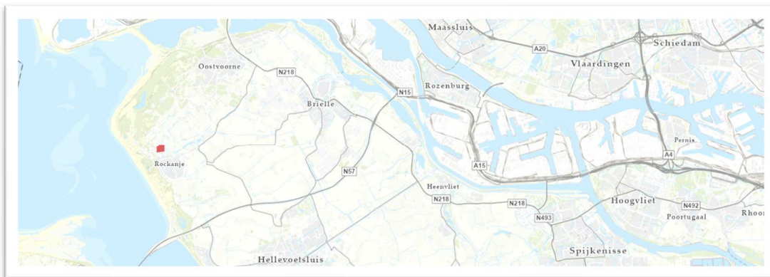
Locatie: Korteweg 1 te Rockanje