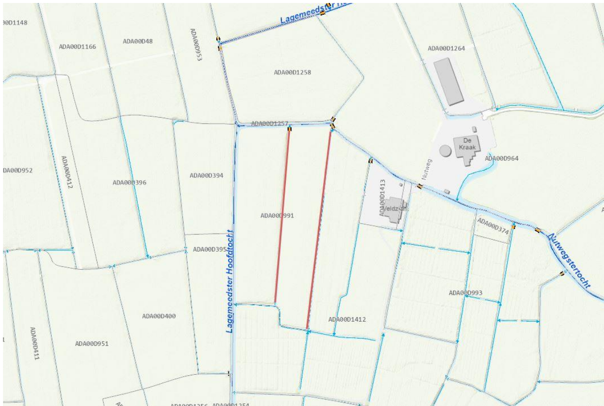
Figuur 2: locatie van de te verbreden watergangen.