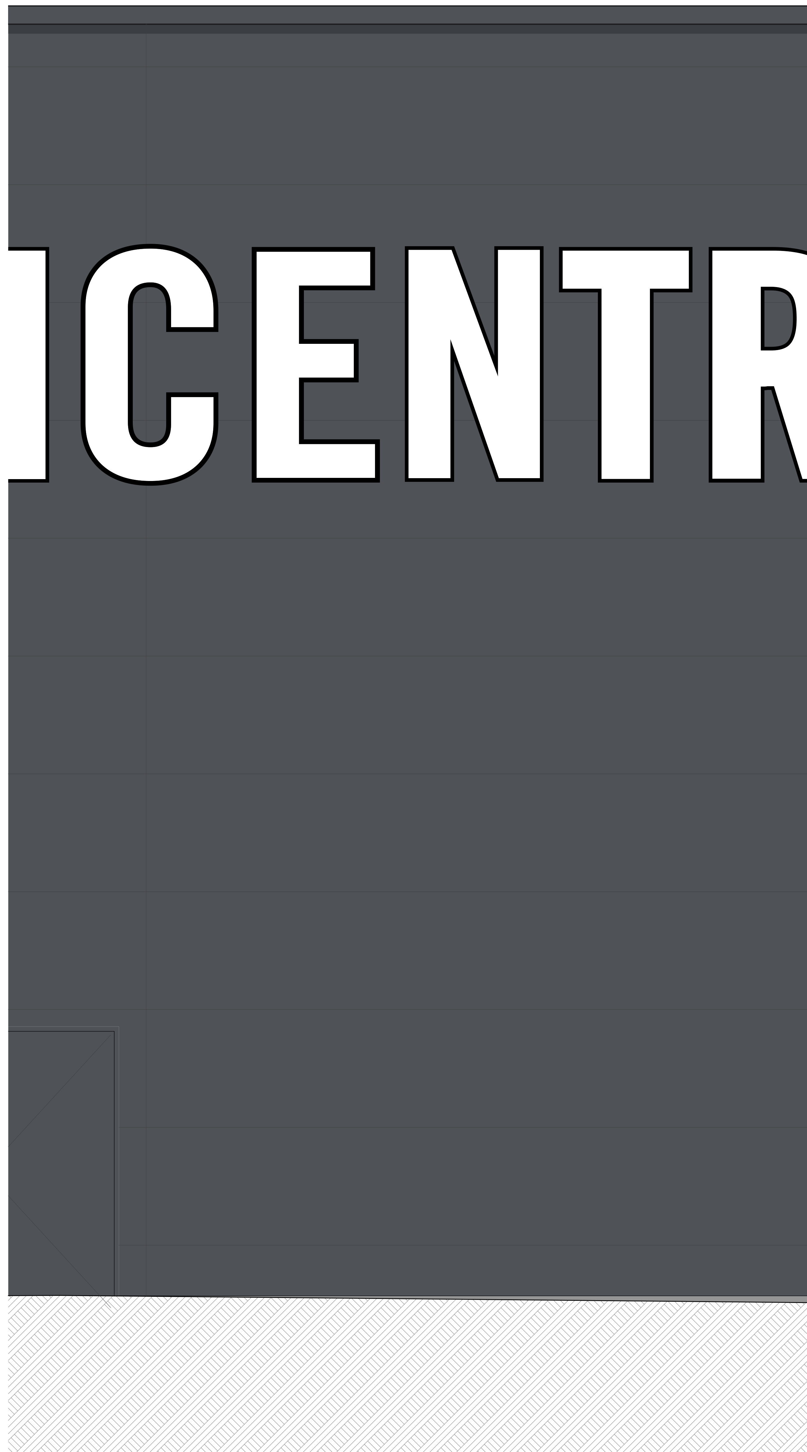
GEVEL (s. 1:20)