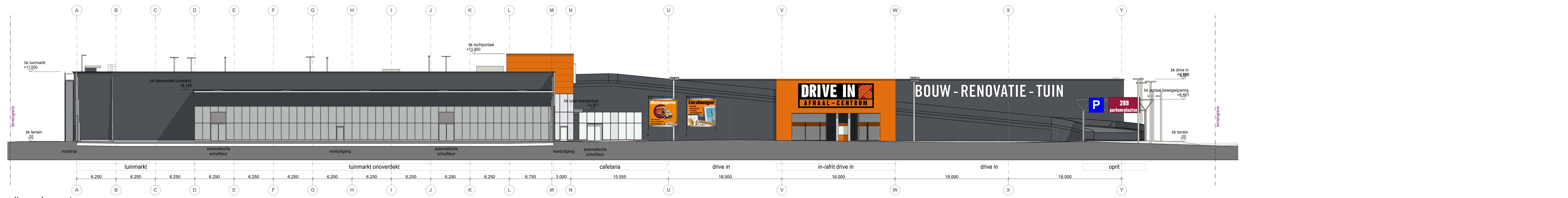
zijgevel - oost