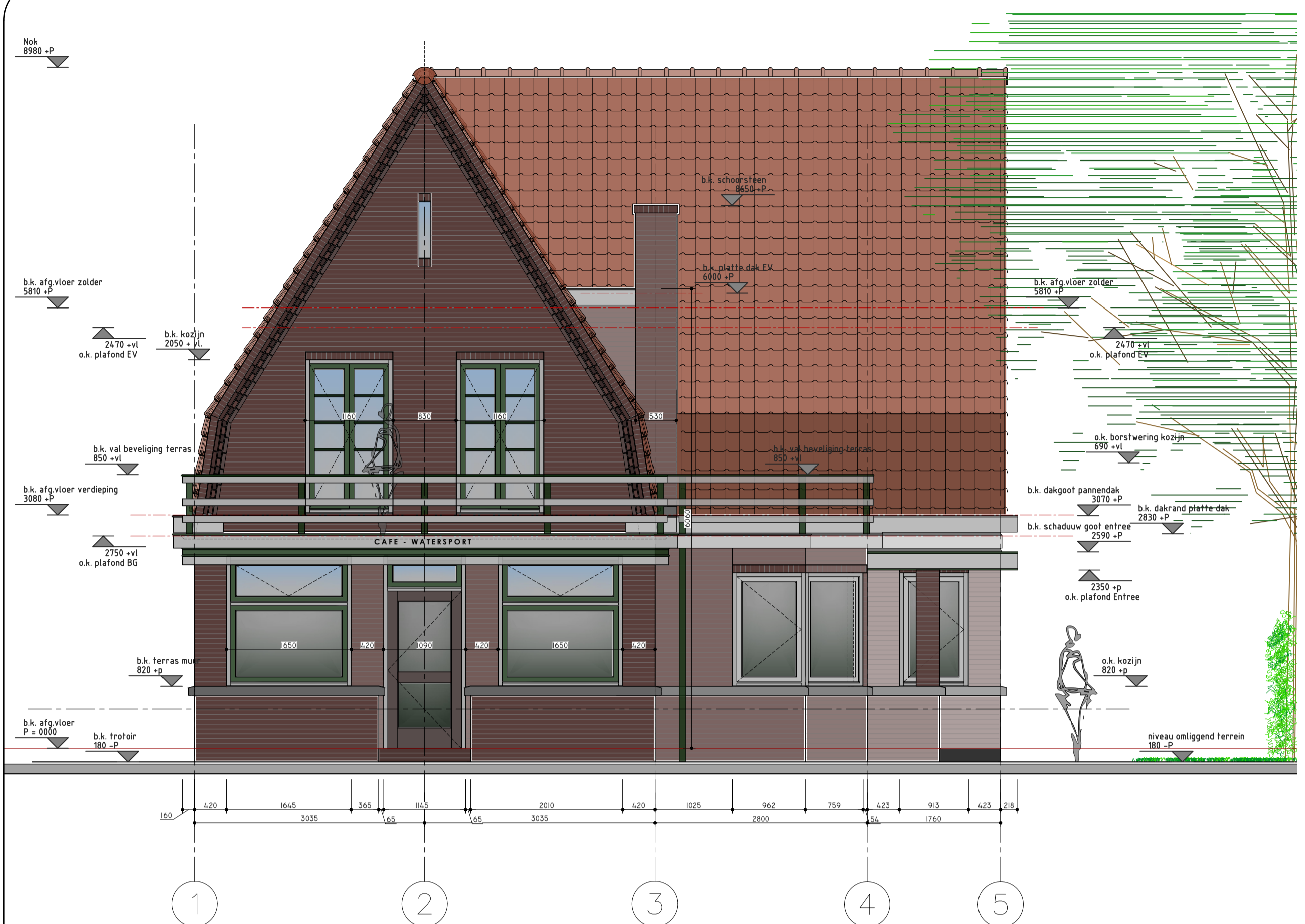
VOERGEVEL (ZUID-OOST) BRESTAANDE SITUATIE SCHAAL 1:50