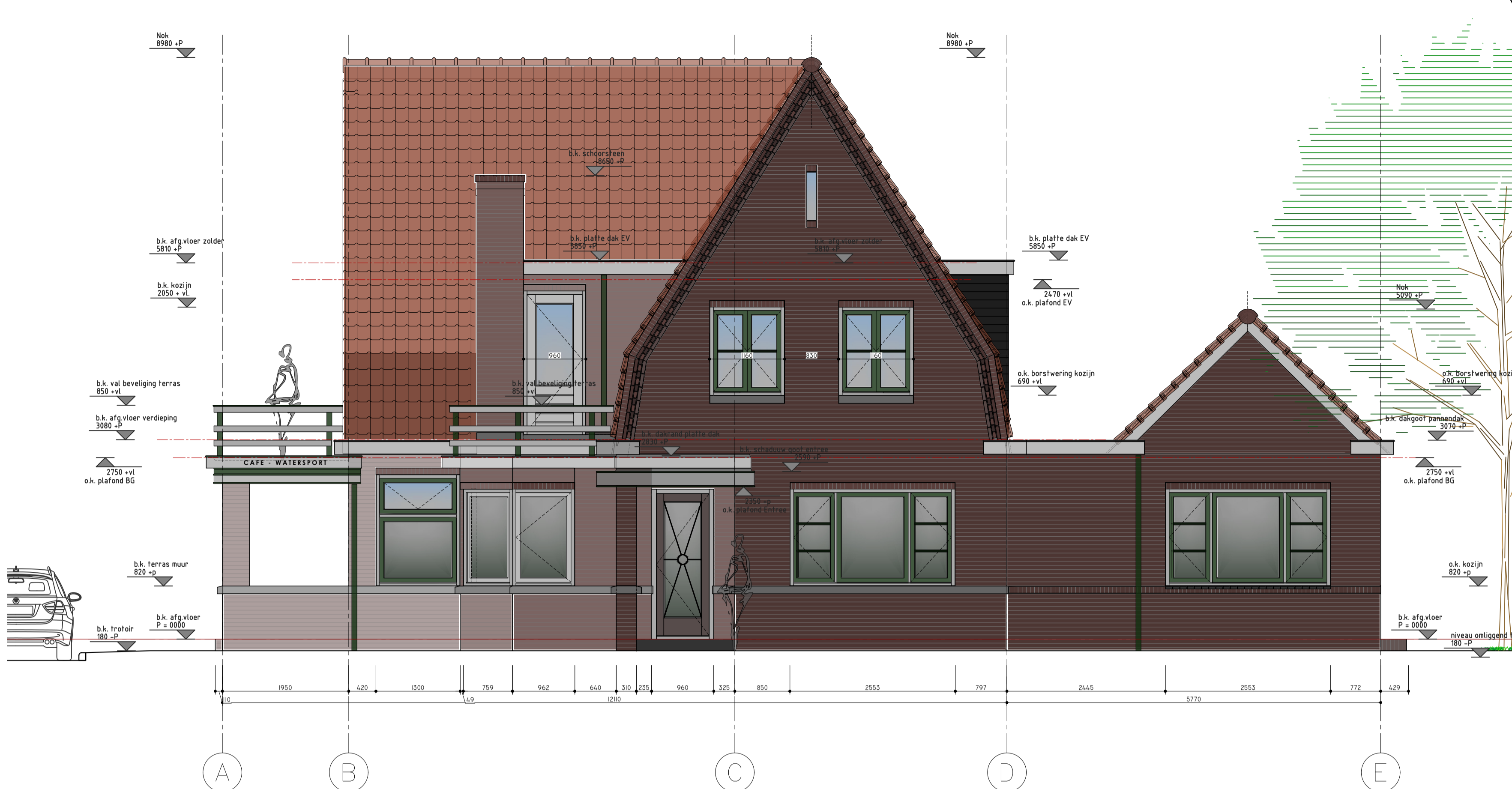
ZIJGEVEL (NOORD-OOST) BRESTAANDE SITUATIE SCHAAL 1:50