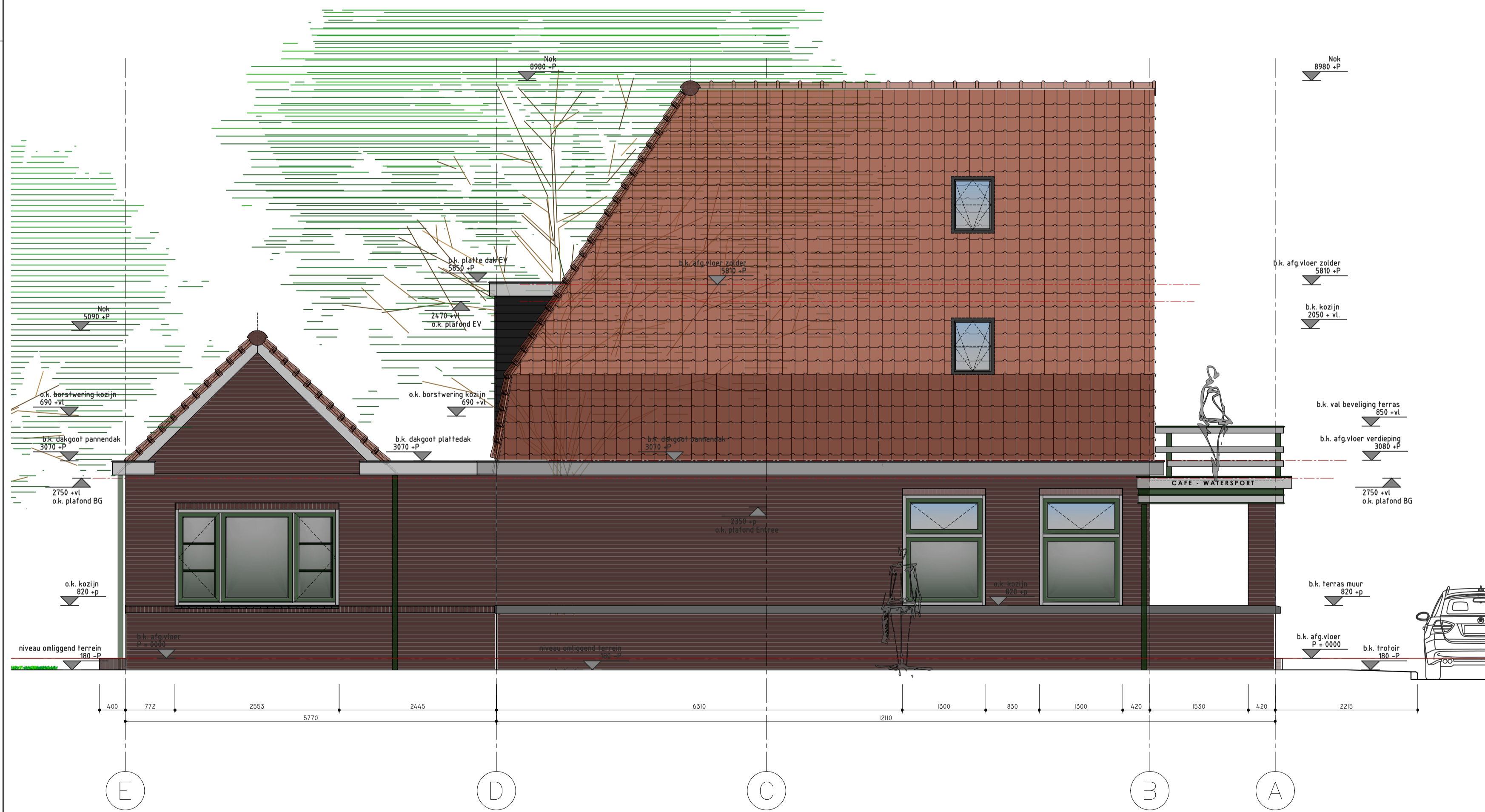
ZIJGEVEL (ZUID WEST) BRESTAANDE SITUATIE SCHAAL 1:50