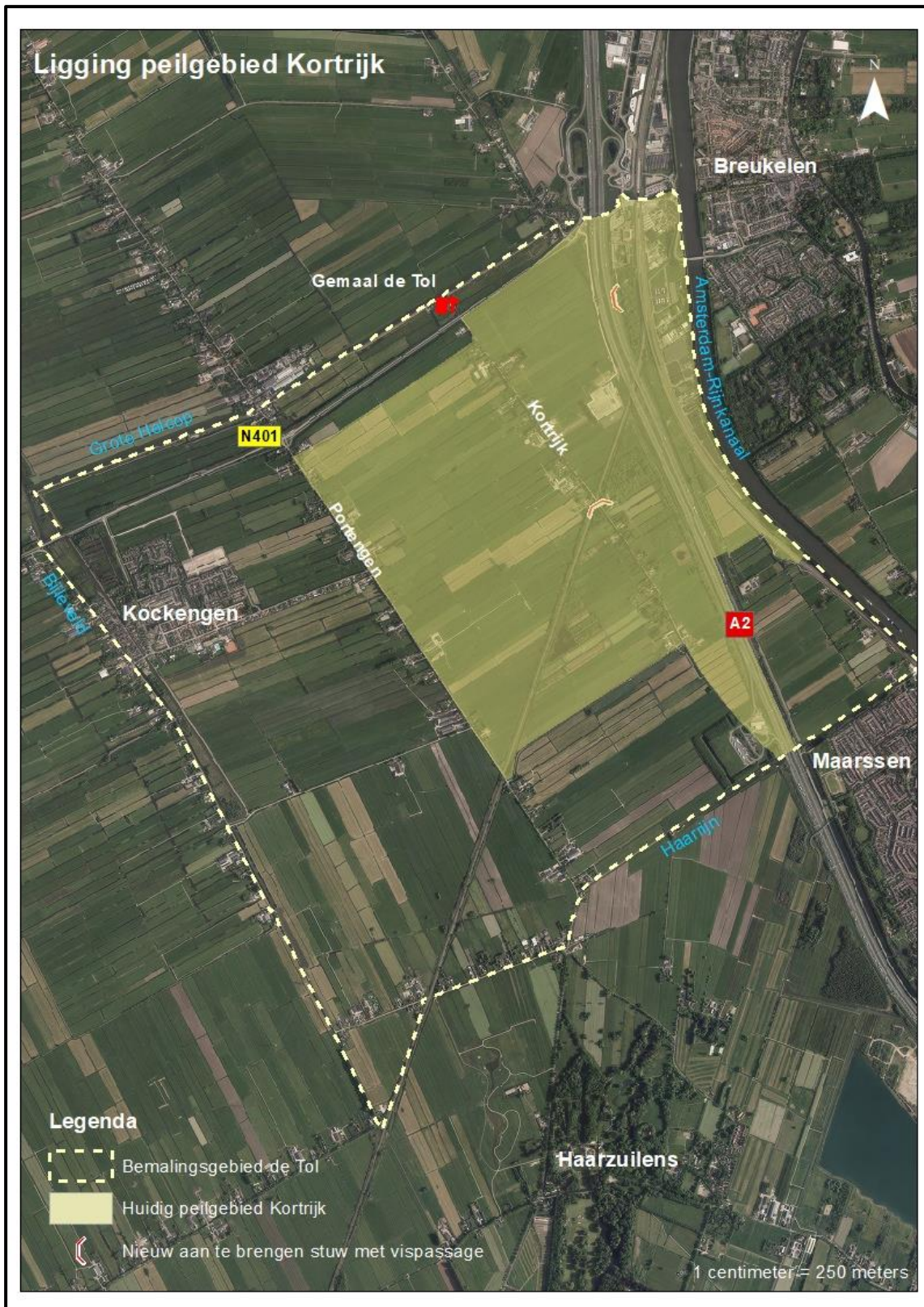
Figuur 1. Ligging peilgebied Kortrijk in bemalingsgebied de Tol.