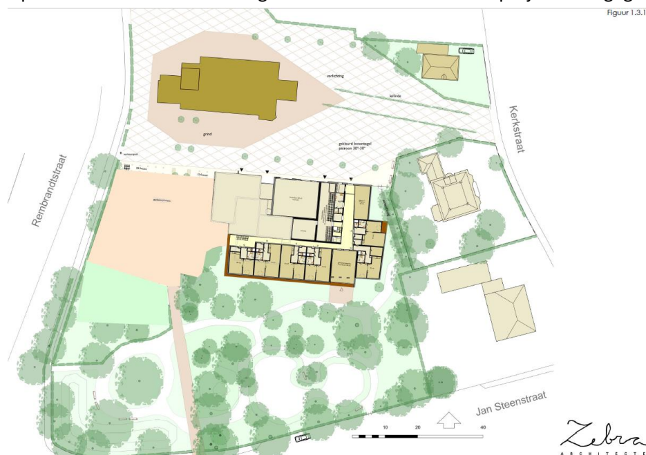
Figuur 1 links: ligging van de projectlocatie & impressie stedenbouwkundige schets

Op de onderstaande afbeelding is de situatieschets van het project weergegeven.