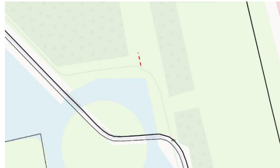
2018-011493, Overslagpad en Akerdijkse bos