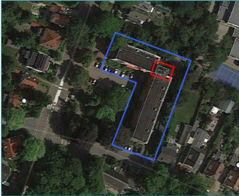
Figuur 1: Plangebied met te renoveren complex - blauwe kader. Het rode kader betreft het te renoveren ketelhuis.